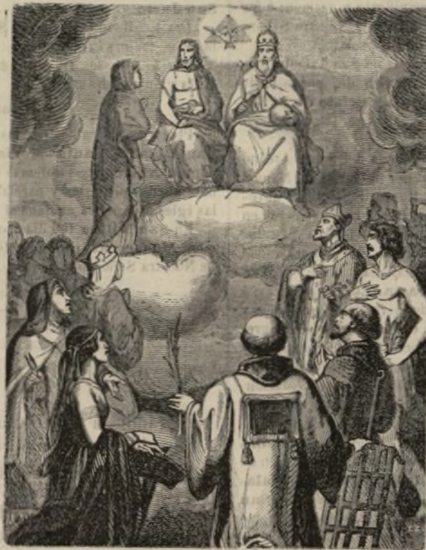
Fiesta de Todos los Santos.

Día 3. — Santos Innumerables Mártires de Zaragoza, Valentino, presbitero, Hilario, diácono, Germano, Cesáreo, Teófilo, Vital, mrs., Wenefrida, vg. y mr., Malaquia, Domno, Humberto, Pirmino, Hermengol y Hermenegandio, obs., y Silvia, madre de San Gregorio. Los Innumerables Mártires de Zaragoza. El perfecto Daciano expidió un decreto para que todos los cristianos de Zaragoza abandonasen la ciudad; obedecieron á tan despótica orden llenos de santa resignacion y entonando el Gloria in excelsis Deo ; mas apenas hubieron pasado las puertas de la ciudad: fueron degollados por soldados preparados al efecto: sus cuerpos fueron quemados con los de unos criminales para que no pudieran