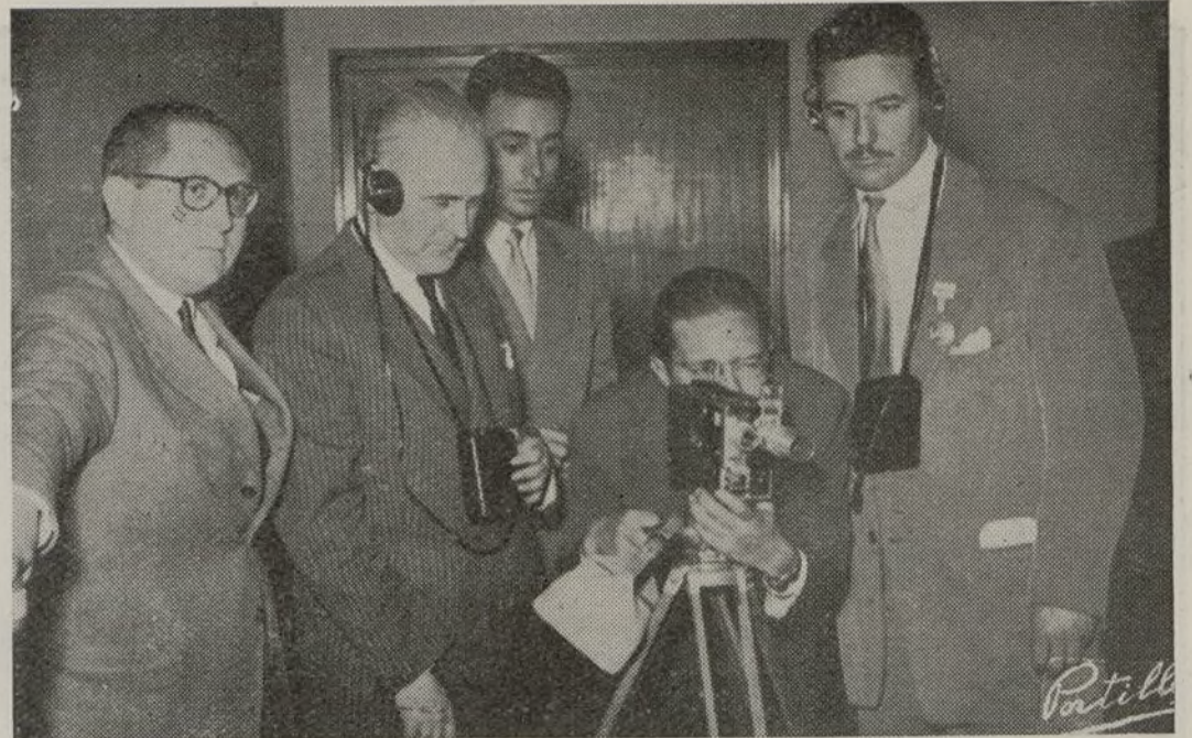
Todo el ambiente de trabajo del VIII Congreso Internacional de Cirugía, será reflejado en un documental, que realizan técnicos españoles. He aquí un momento del "rodaje" de este interesante documental.

Entre las innumerables películas que se presentan en este Congreso, hay que destacar el lote de films aportados por mister Boris, que presenta