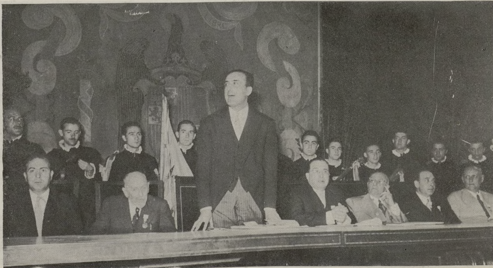
El Ministro de Educación Nacional, Sr. Ruiz Jiménez, durante el discurso inaugural.

La Sala de Proyecciones está designada como Aula número 8 del orden general. La entrada es libre.