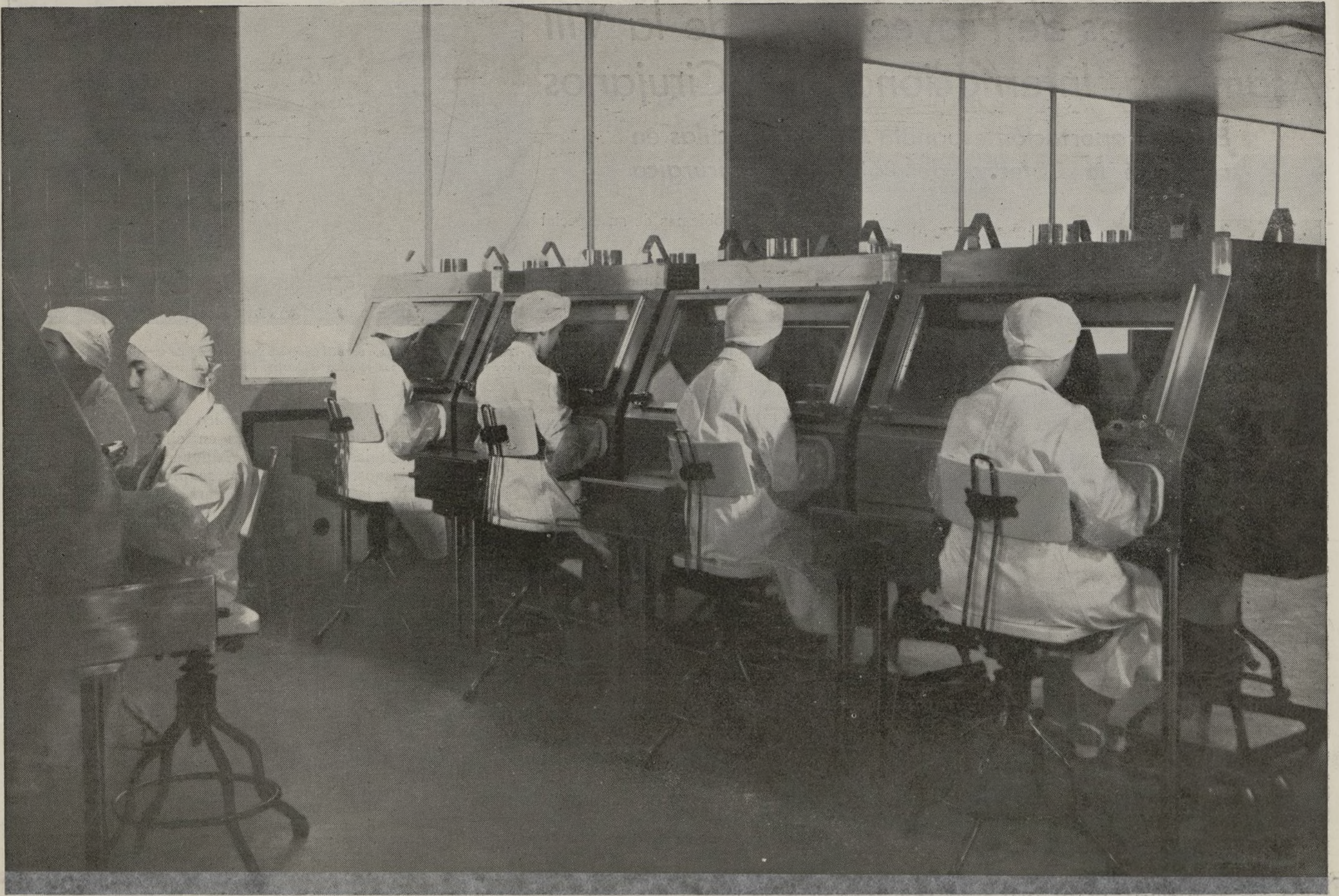
SALA DE CUBICULOS