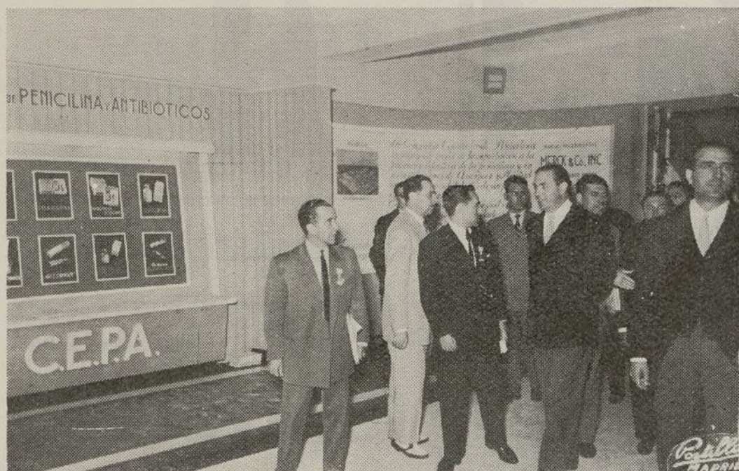
Momento de inaugurarse la Exposición de Material Quirúrgico y Científico, instalada en la Facultad de Medicina.

dejan un amplio campo abierto para el estudio y la investigación. Termina su intervención expresando la esperanza de que el Congreso sea provechoso y todos puedan aprender algo en él.