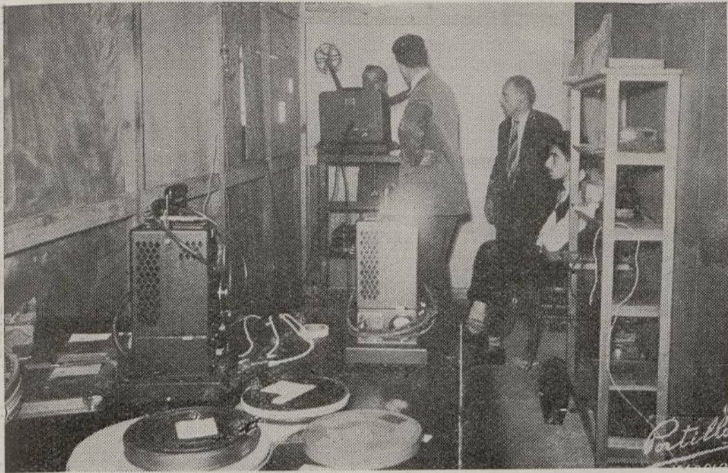
Destinada el Aula 6 a "Cinematógrafo", se han hecho todas las obras necesarias para instalar una cabina de proyección, perfectamente equipada, como se ve en esta fotografía, servida por unos expertos técnicos españoles.

Entre la aportación española figuran películas en color de la Cátedra de Patología Quirúrgica