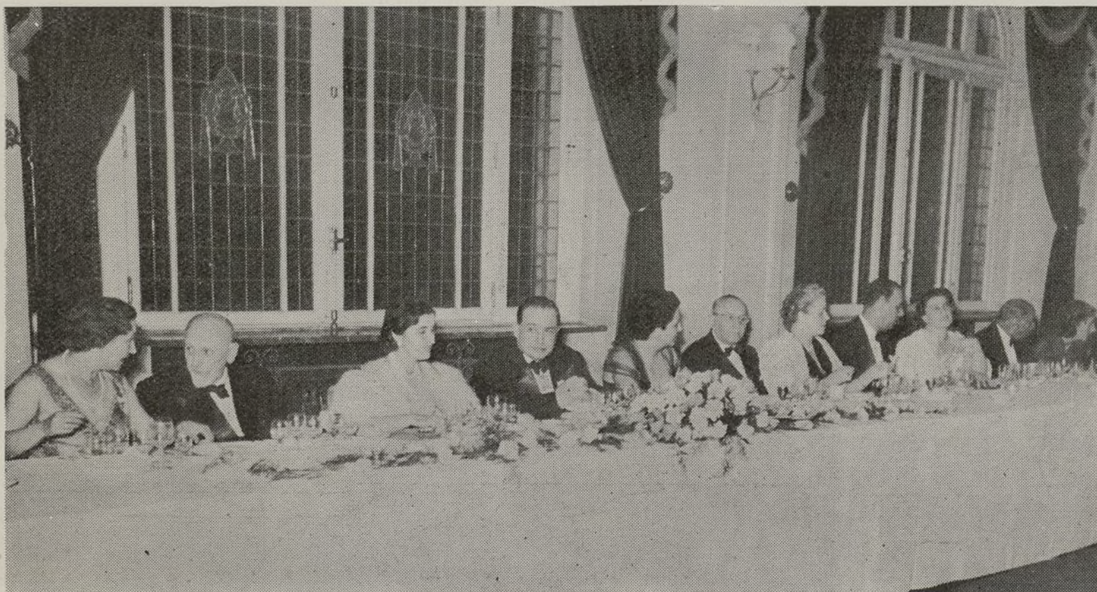
La Marquesa de Villaverde en la Presidencia del banquete de gala celebrado la noche antes de la inauguración del Congreso.