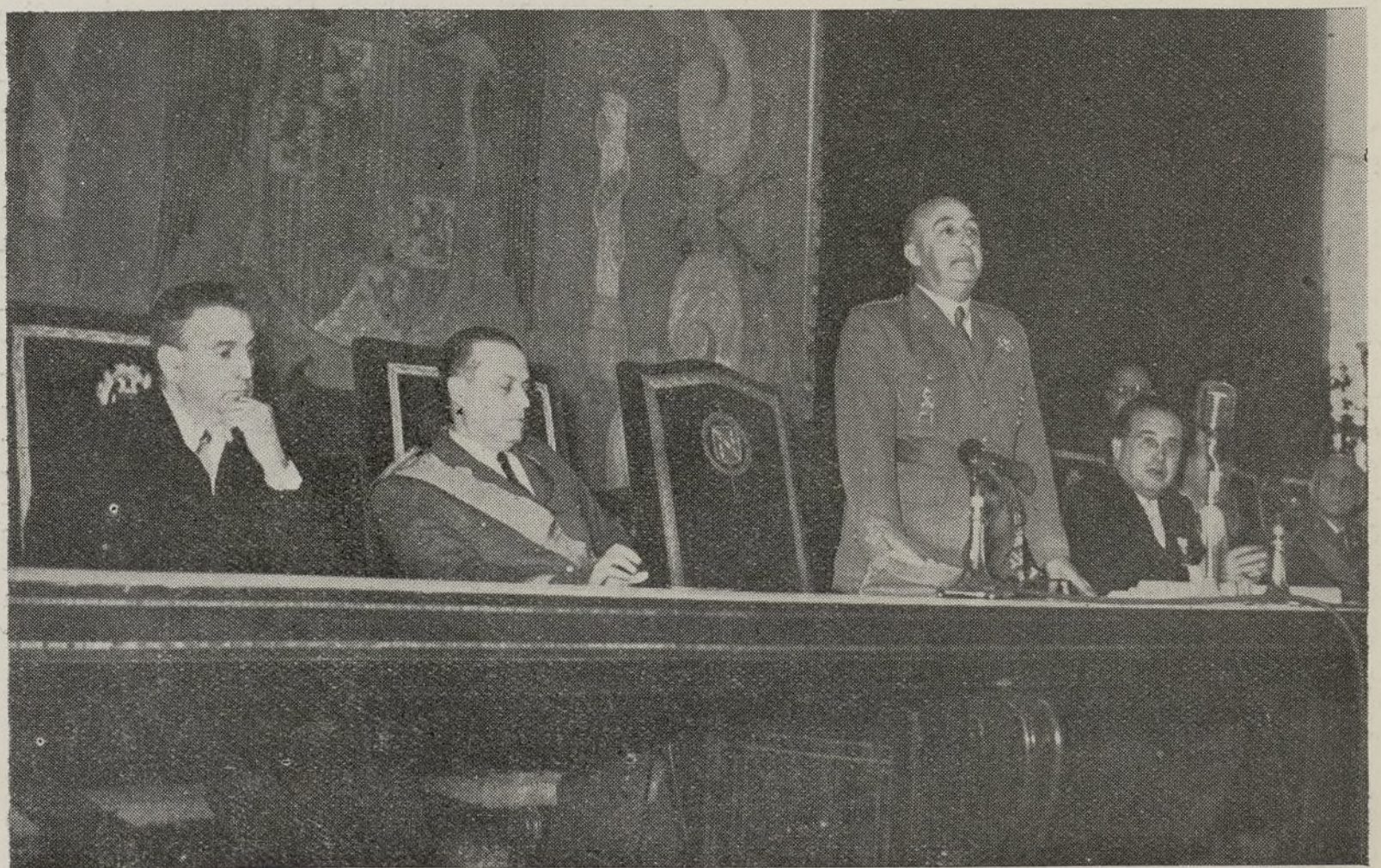
Su Excelencia el Jefe del Estado durante el discurso de clausura del Congreso Internacional de cirujanos.

CIRUGIA, con el entusiasmo y celo con que ha contribuido a la celebración del Congreso, quiere dedicar estas últimas líneas a despedir a las ilustres personalidades que nos han honrado con su presencia en estos días brillantes para la ciencia.