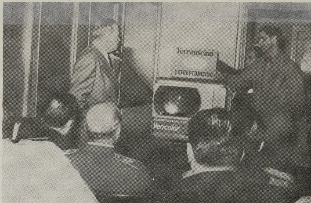
Su Excelencia presenciando una emisión de televisión en colores.

Esta tarde se ha procedido a la lectura de la cuarta ponencia sobre «Cirugía cardiovascular», y se han terminado la presentación y discusiones de las comunicaciones libres.