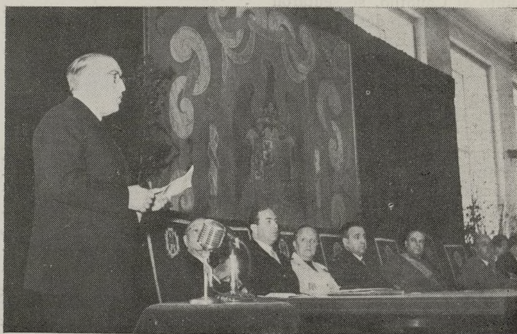
El ilustre doctor don Gregorio Marañón en un momento de su discurso en homenaje a Ramón y Cajal.

Esta edición especial de «Cirugía» ha sido realizada, como puede apreciarse, en el breve plazo de unas horas. Confiamos en que nuestros lectores sabrán valorar este esfuerzo, disculpando cualquier falta o error si lo hubiere.