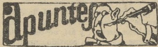
MIRANDO AL MAÑANA.

Los Comités de la Confederación Nacional y la Confederación Regional del Trabajo de Cataluña advierten a todos los trabajadores que no se dejen sorprender por unas hojas que han circulado por ahí, carentes en absoluto de solvencia en la organización obrera, anunciando una huelga para el día 25 del corriente. Es absolutamente falso y nadie debe dejarse sorprender por los oportunistas sin responsabilidad en la C. N. T.