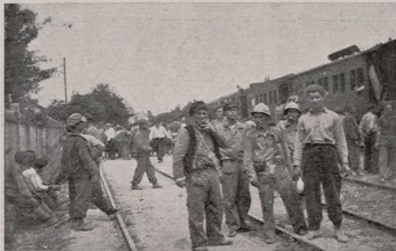
Partenza per Huesca