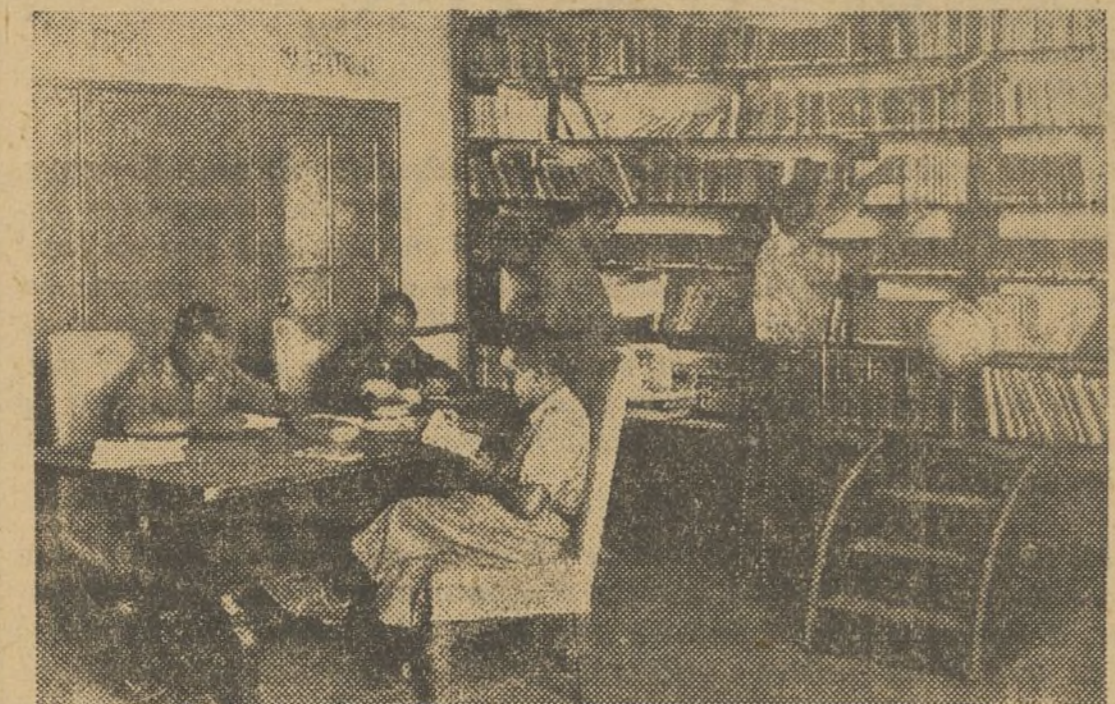
Una de les dependències més predilectes del combatent: la Biblioteca