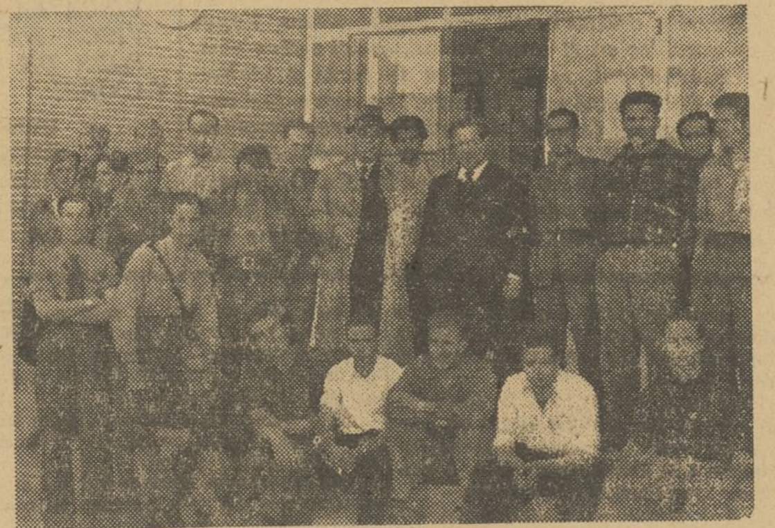
La Llar s'ha vist honorada diverses vegades amb la visita d'alguns dels consellers de la Generalitat...