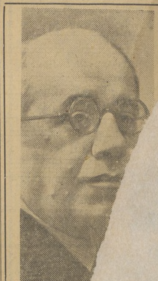
Manuel Azana, República

1 1 ma. zona delit la porta no talunya no volen ver deixa neta de tr onaris a xis