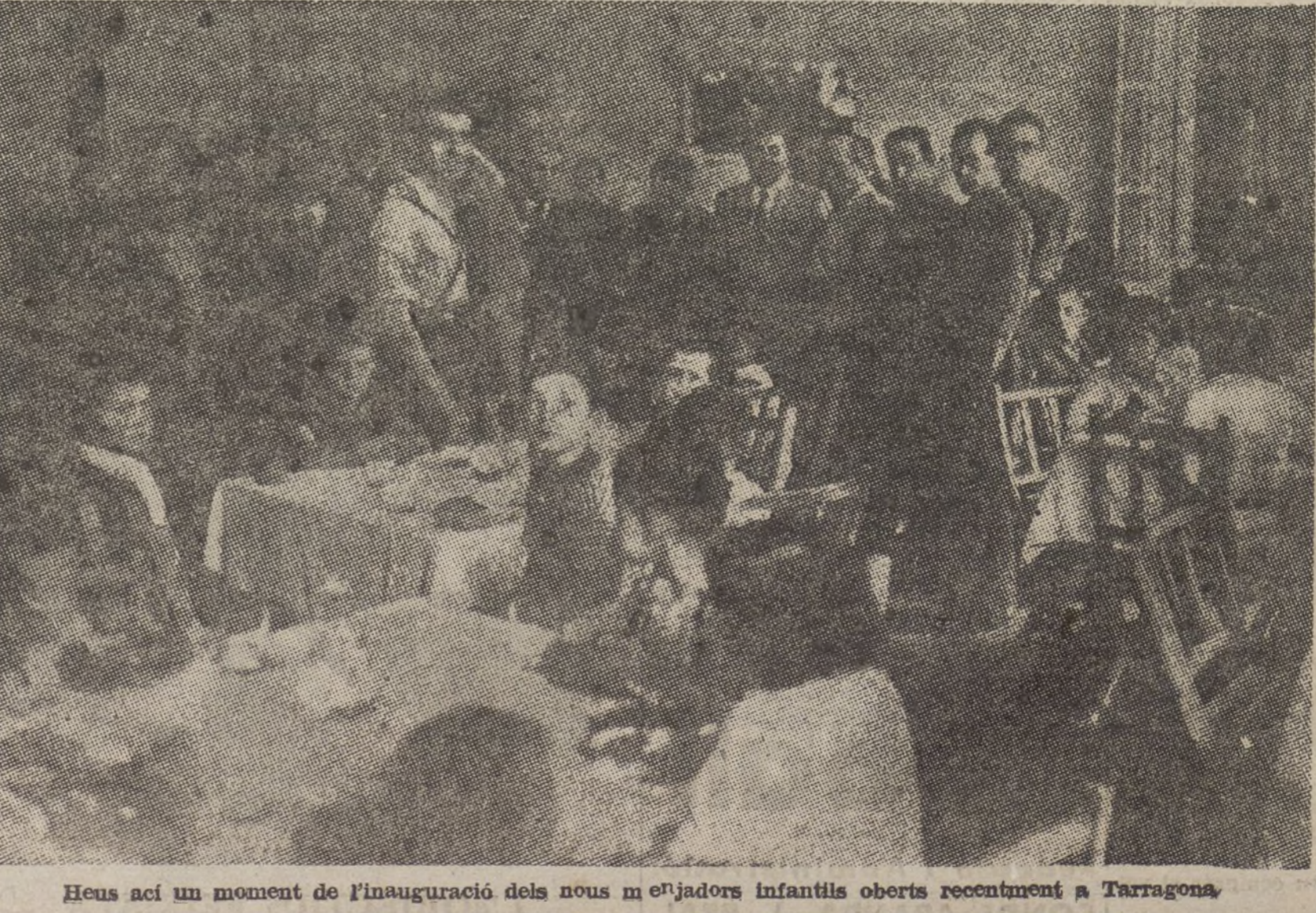
Heus ací un moment de l'inauguració dels nous menjadors infantils oberts recentment a Tarragona.