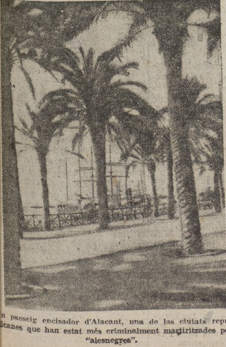
Un passeig encisador d'Alacant, una de las ciutats republicanes que han estat més criminalment martiritzades pel "alesnegres".