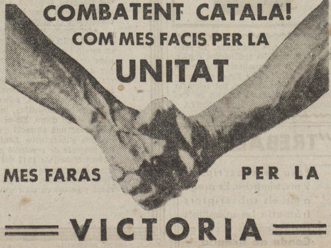
MES FARAS PER LA VICTORIA

En la última reunió del Comitè Central del P. S. U. de Catalunya es diu que el Partit Socialista Unificat "és fruit de la voluntat del proletariat català de tenir el seu instrument de lluita per l'alliberament nacional i social de Catalunya". Res més cert que aquesta afirmació. El P. S. U., forjat en les primeres batalles de la lluita contra el feixisme, fruit de la unificació dels quatre partits marxistes catalans, no existint sense la classe obrera i els cençenars i milers de camperols que veuen en el Partit Socialista Unificat "és fruit de la voluntat del proletariat català de tenir el seu instrument de lluita per l'alliberament nacional i social de Catalunya". Res més cert que aquesta afirmació. El P. S. U., forjat en les primeres batalles de la lluita contra el feixisme, fruit de la unificació dels quatre