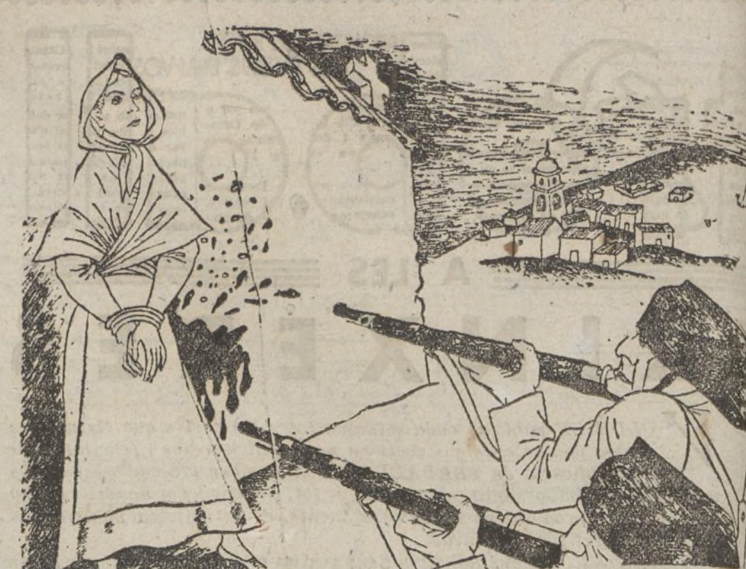
Va aconseguir-ho, però es va preocupar ell mateix que l'enviessin al front una unitat de xoc. L'antic guerriller es moria, fins ara, de ganes de passar-se; però el tenia el temor que prenguessin represalies en la seva germana. Dies enrera va rebre la notícia que aquesta havia mort. Ja no el retenia res. A la matinalda agafa quatre fusell i vingué a les nostres trinxeres. (Il·lustració d'Alloza)

Va arribar a les nostres línies carregat amb quatre fusells. —Com posen aquests estris! I es va aixugar la suor que li corria cara avall. Era un xicot andalús. —No sabeu el que m'ha costat d'arribar fins aci. M'he equivocat dos cops de camí i ha estat a punt de tornar a les trinxeres dels facciosos. —Has esmorzat? —No re tingut temps. —Tens gana? —Ja ho crec! —Apa, doncs; esmorzaràs amb nosaltres. Així que la sublevació militar va triomfar a la provincia, ell, amb uns quants companys socialistes i republicans, va dedicar a hostilitzar les forces faccioses.