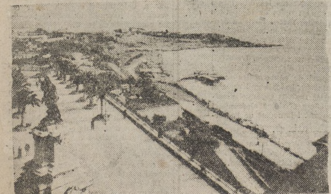
La immortal Tarraco, una de les poblacions catalanes que més ha patit la barbàrie dels invasors.