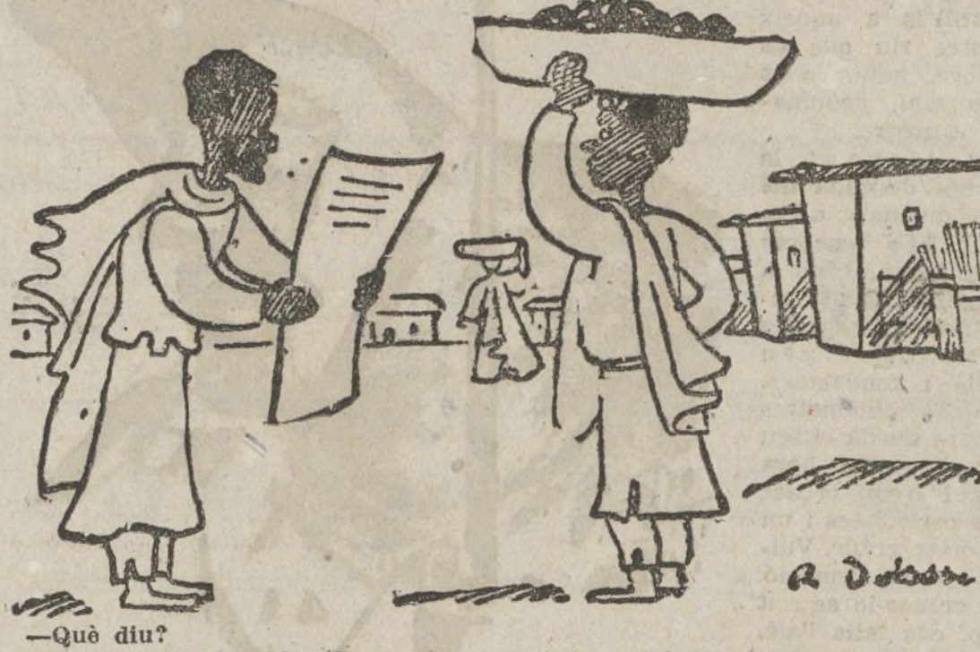
Què diu? -Doncs que els pobles deuen disposar d'ells mateixos.

Endavant, hereus de nostra terra sempre avant, jovent adolorat; som ja avui l'orgull i el triomf del nou Món obrer alliberat.