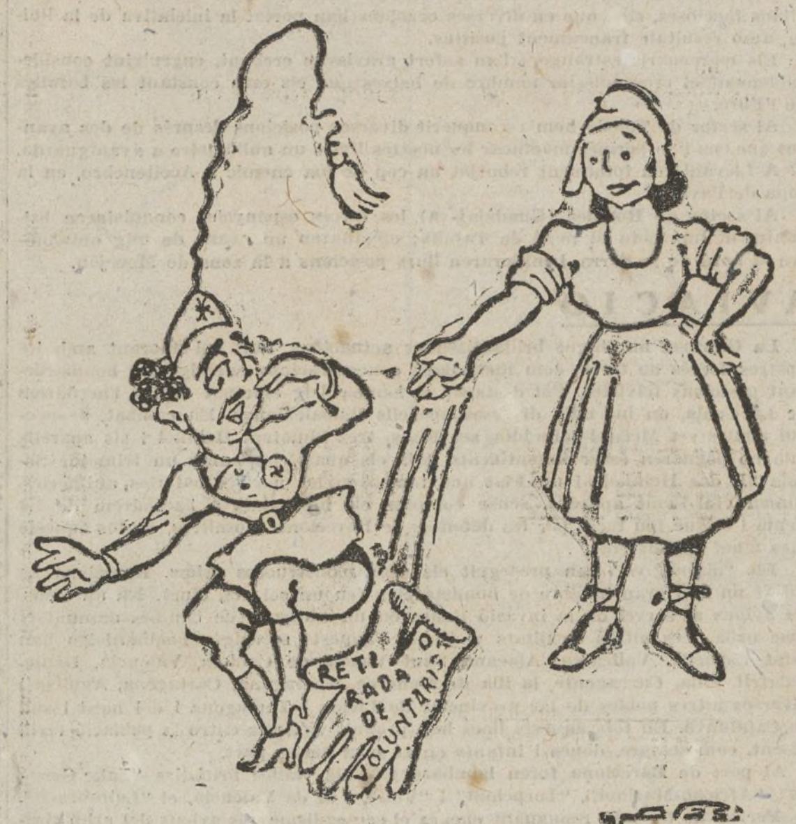
LA REPUBLICA.—I ara, si vols, lluitarem sols.