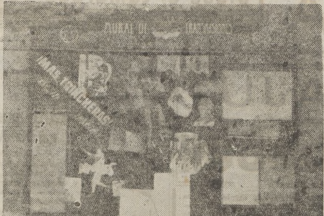
Periòdic mural de la Companyia de Transmissions de la 33 Divisió, en la qual un gran nombre de soldats catalans, junt amb els d'altres terres espanyoles, treballen i lluiten amb un elevat sentit patriòtic per l'alliberament de la República.