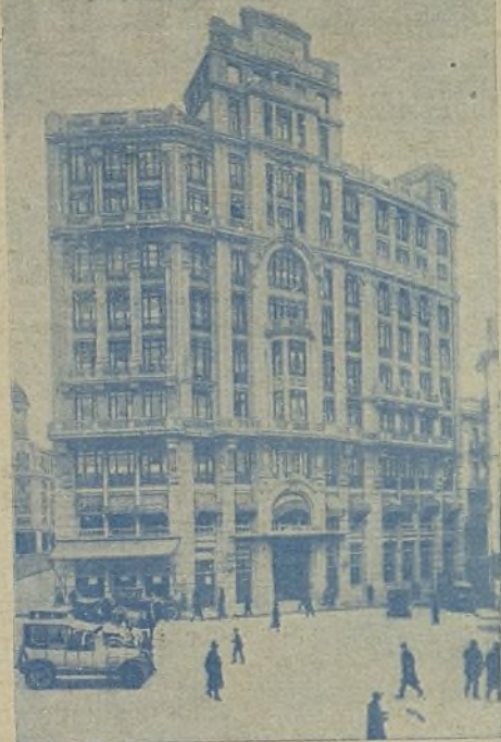
HOTEL FLORIDA MADRID