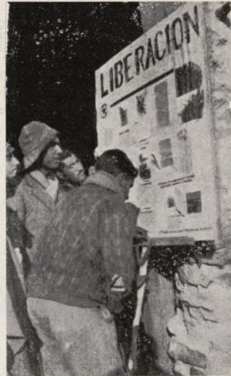
Soldados de nuestra brigada leyendo el periódico mural