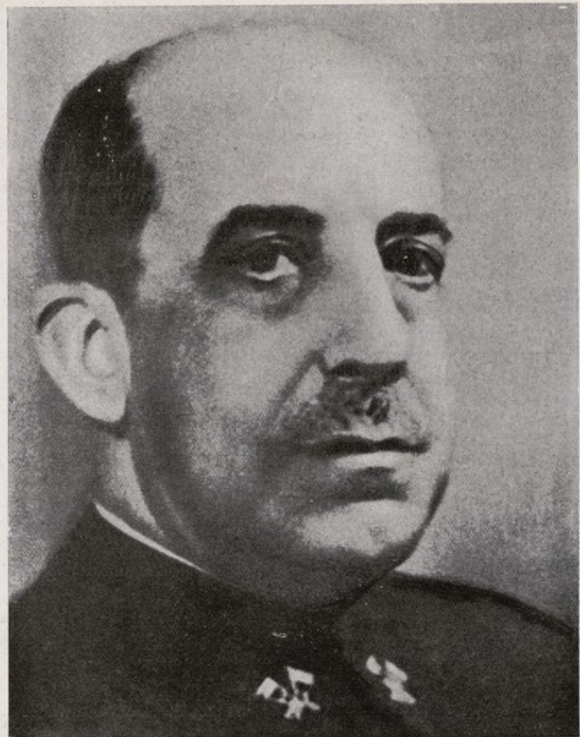
La Sexta Brigada Mixta, en su periódico "Liberación", saluda al GENERAL POZAS. — Jefe del Ejército del Este

Estamos hartos de oír: "Sí, nosotros quizá ganaremos, pero ellos nos han tomado el Norte....", o "Yo prefiero que se acabe, sea como sea...". Estamos cansados de que haya quien se dedica a propalar noticias falsas con intenciones evidentes de desmoralizar. Tenemos una fe y una confianza absoluta en la victoria y eso no lo decimos en una reacción nerviosa, sino que tenemos una conciencia exacta del volu-