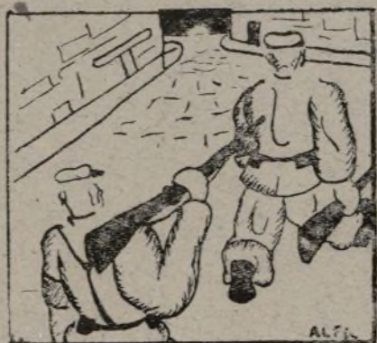
Hasta que sin dar con él vuelven de noche al cuartel.