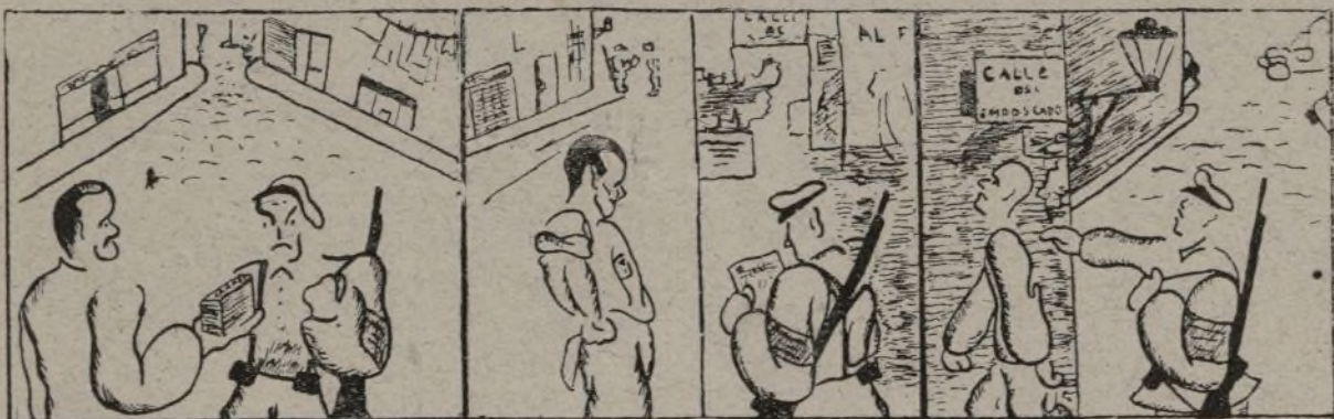
Al que le dan el parón lleva documentación