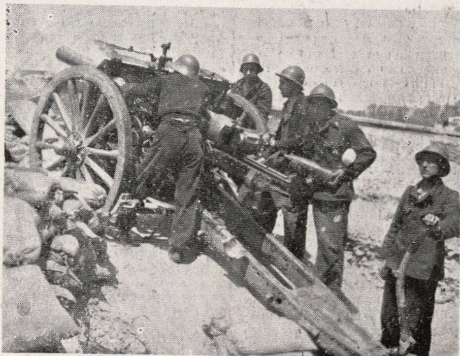
Así se labora por la causa