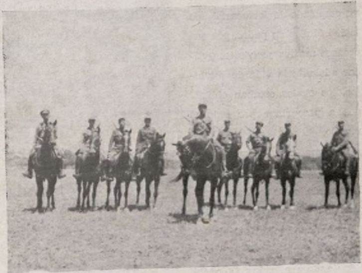
Momentos de los ejercicios de nuestra Caballería.

neros que algunos dicen: "no hay diferencia entre los soldados y los oficiales; son