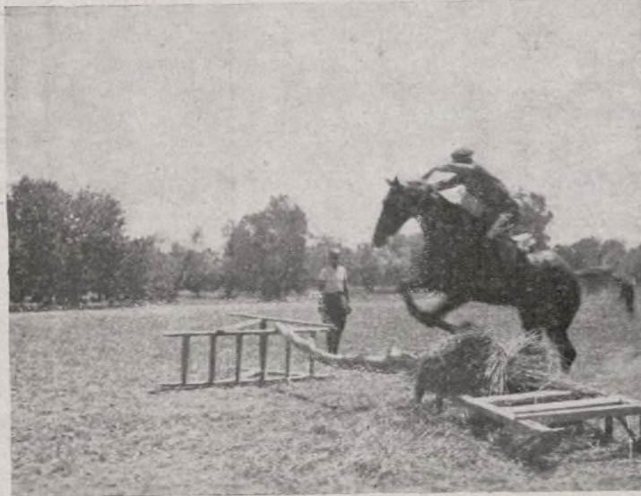
El comandante muestra un salto a los soldados.

He empezado como soldado; ahora soy comandante de Escuadrón y creo que este puesto, con honor, lo podré llevar a cabo."