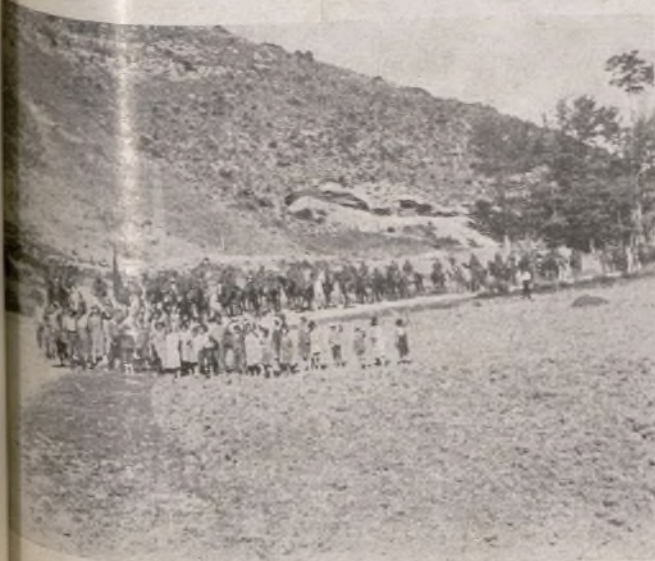
El pueblo despide con cariño a nuestra Caballería.

Nosotros demostraremos siempre las faltas cometidas por cualquiera que sea. Le enseñaremos y cada uno aprenderemos de las faltas hechas, pero no permitiremos a nadie que bajo la consigna "luchamos contra el desorden y la desorganización por medio de la "autocrítica", destruya la disciplina militar. La mayor parte de los camaradas soldados trabajan con entusiasmo y quieren ver a la cabeza del movimiento pro-liquidación de estas "enfermedades" a sus Comandantes. Los Comisarios políticos y los Delegados de pelotón tienen también un gran papel en este trabajo.