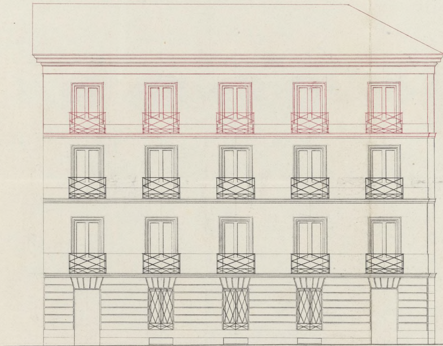
Fachada á la Calle de S. Onofre.