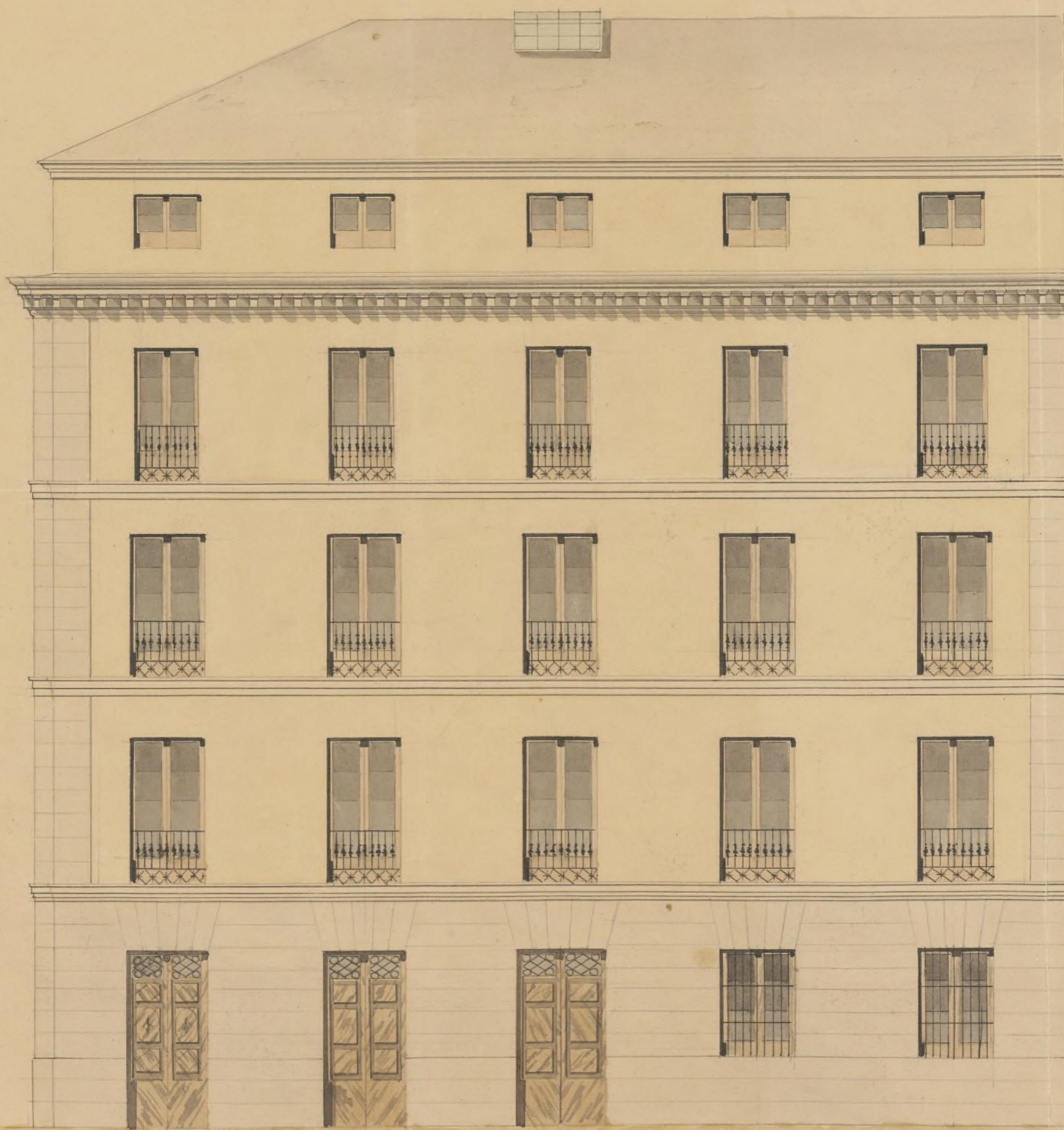
Fachada principal: Calle del Barquillo.

en la Calle del Barquillo esquina à la de Gravina.