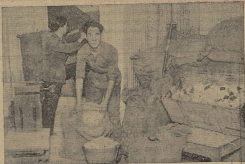
Vista parcial de los almacenes de Asistencia Social de Acción Popular.

¡Afiliados de Acción Popular: No olvidéis su sección de Asistencia Social.