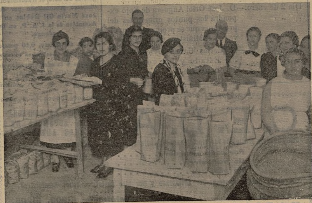
Señoritas de la J. A. P. haciendo la distribución de las raciones que reparte diariamente Asistencia Social.