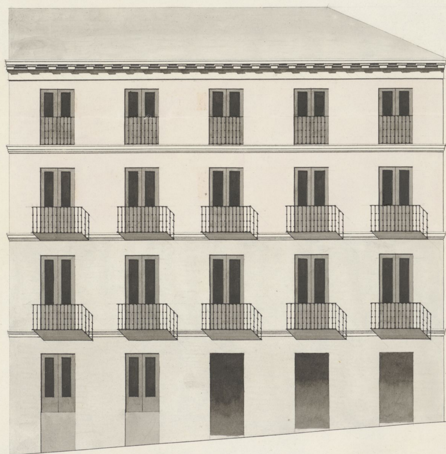
Calle de San José