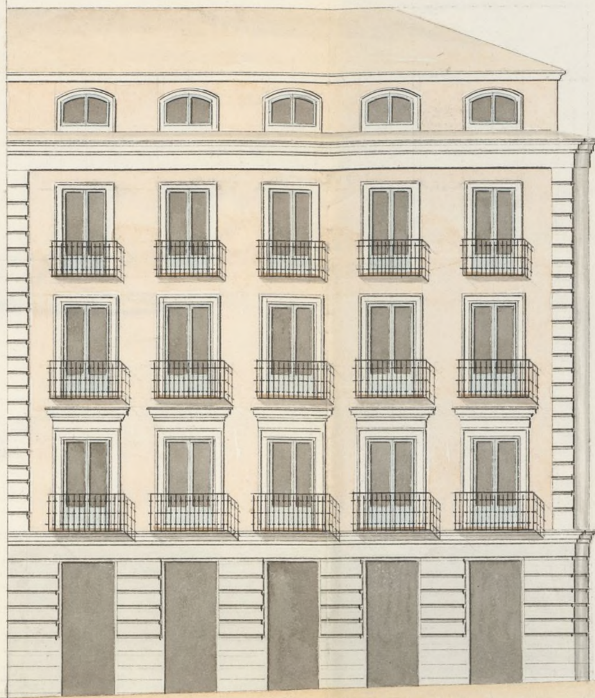
Calle de Silva.