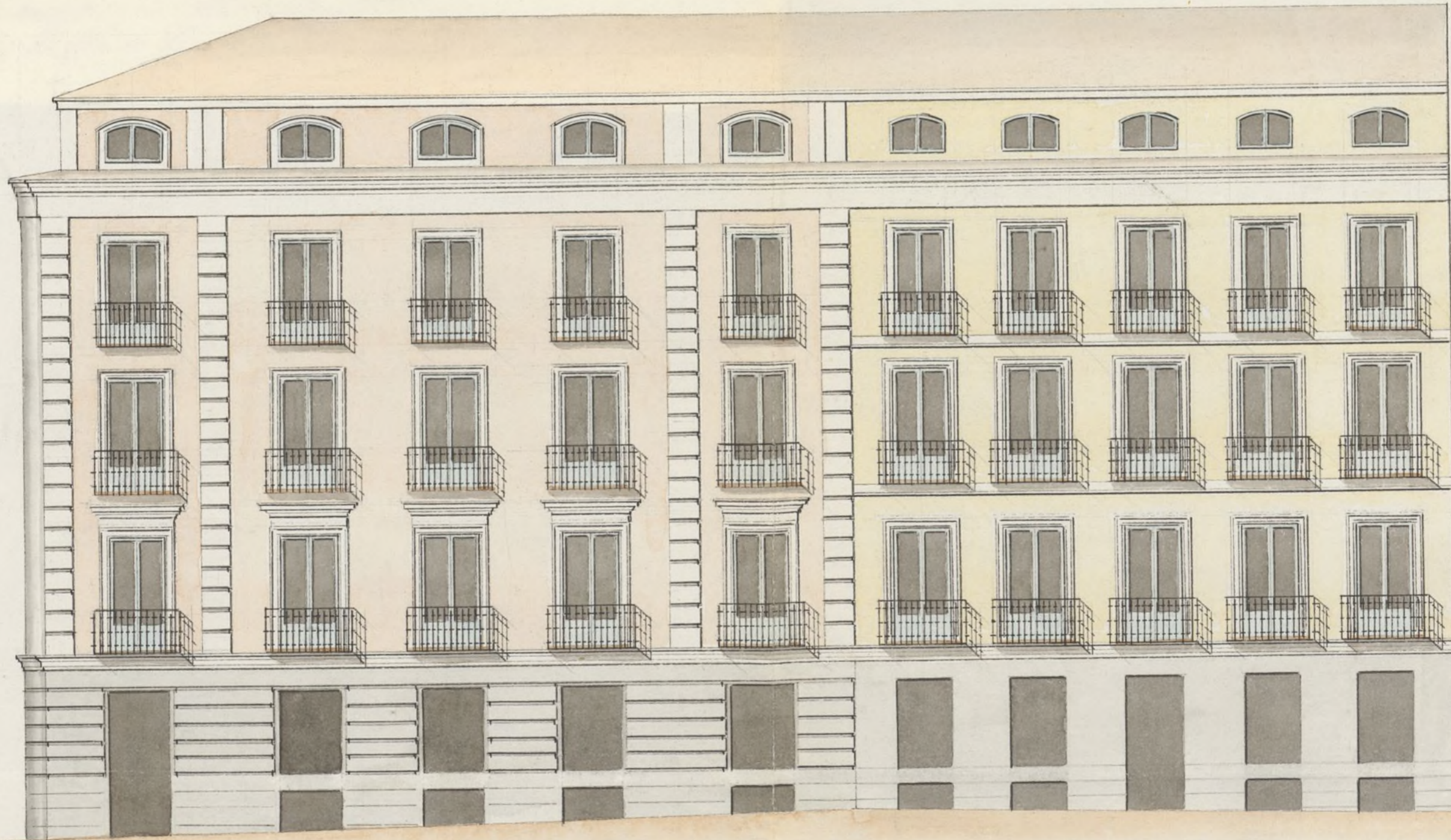
Calle de la Estrella.