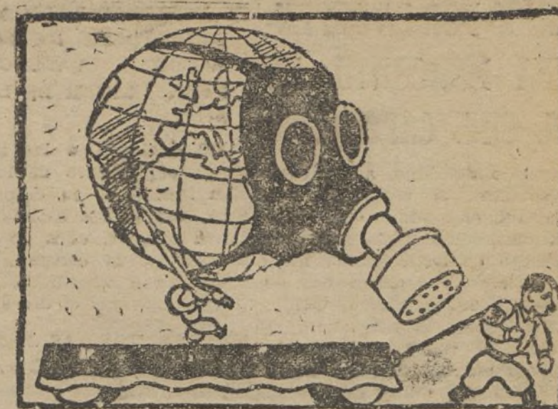
La carroza de este año.