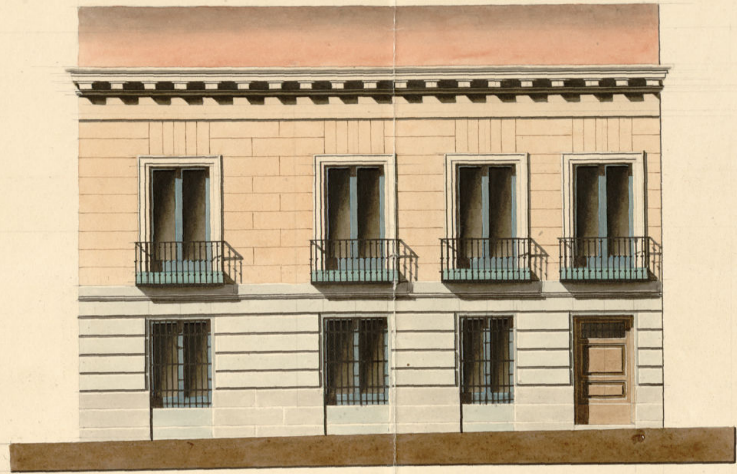
Fachada a la Calle del Niño N.º 7.