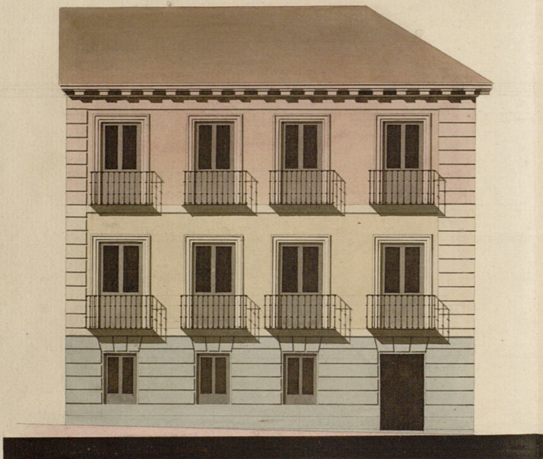
Fachada de las Casas que en la Calle de la Abada se distinguen con