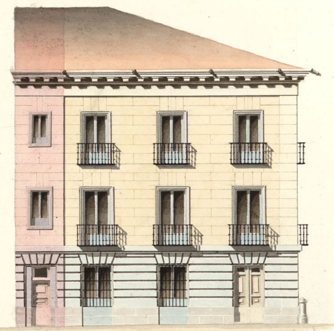
Calle del Pez