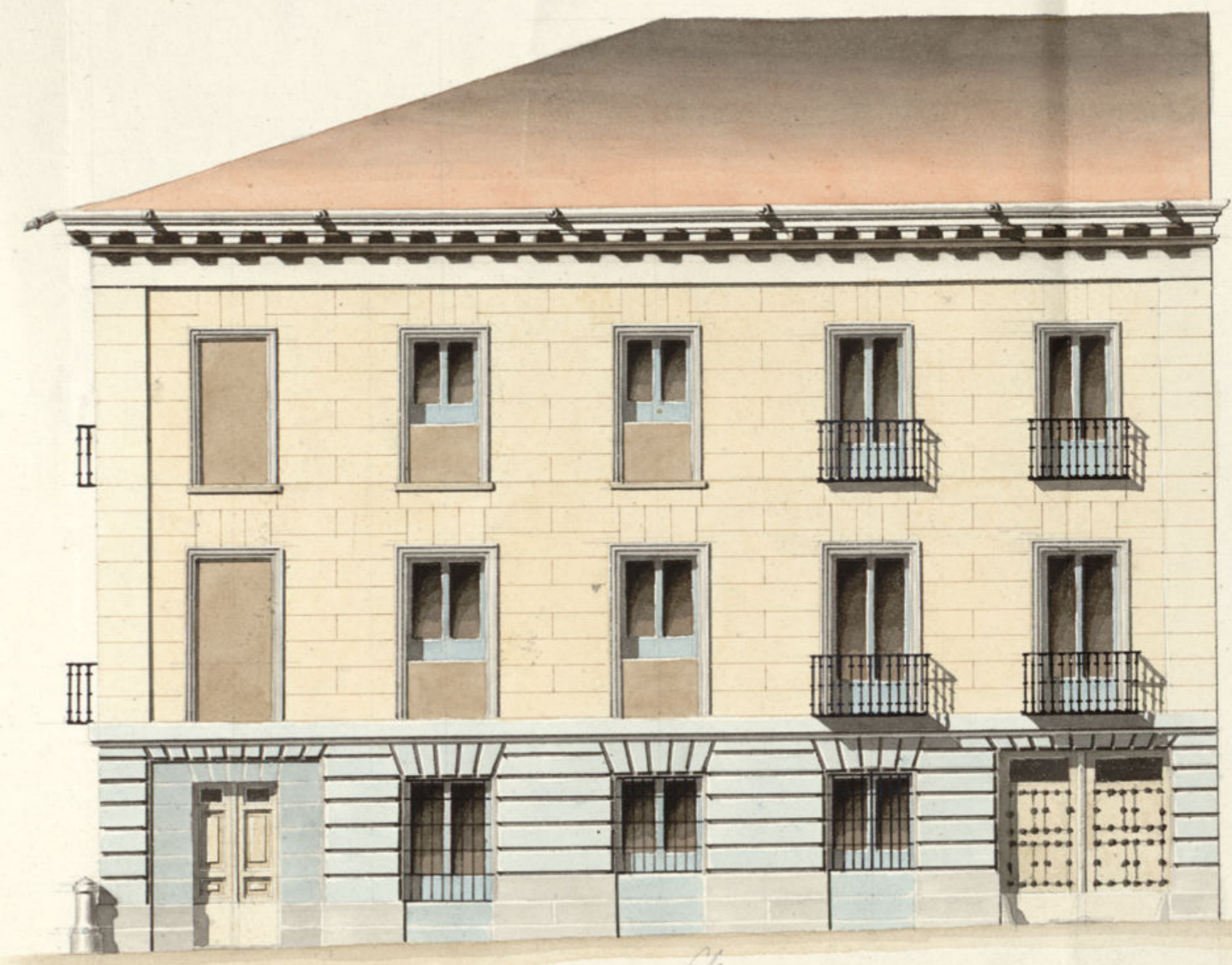
Calle de las Minas alta