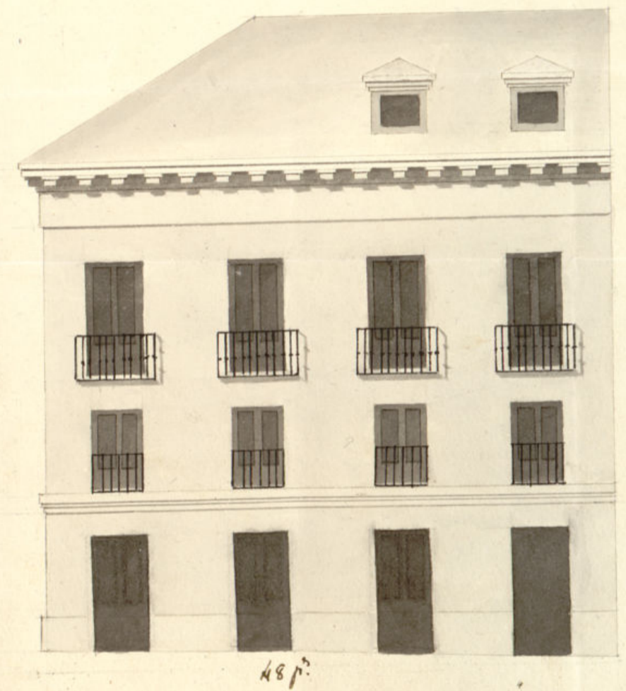
Fachada de la Calle de Toledo, n.º 121 nuevo 8 enijo n.º 99