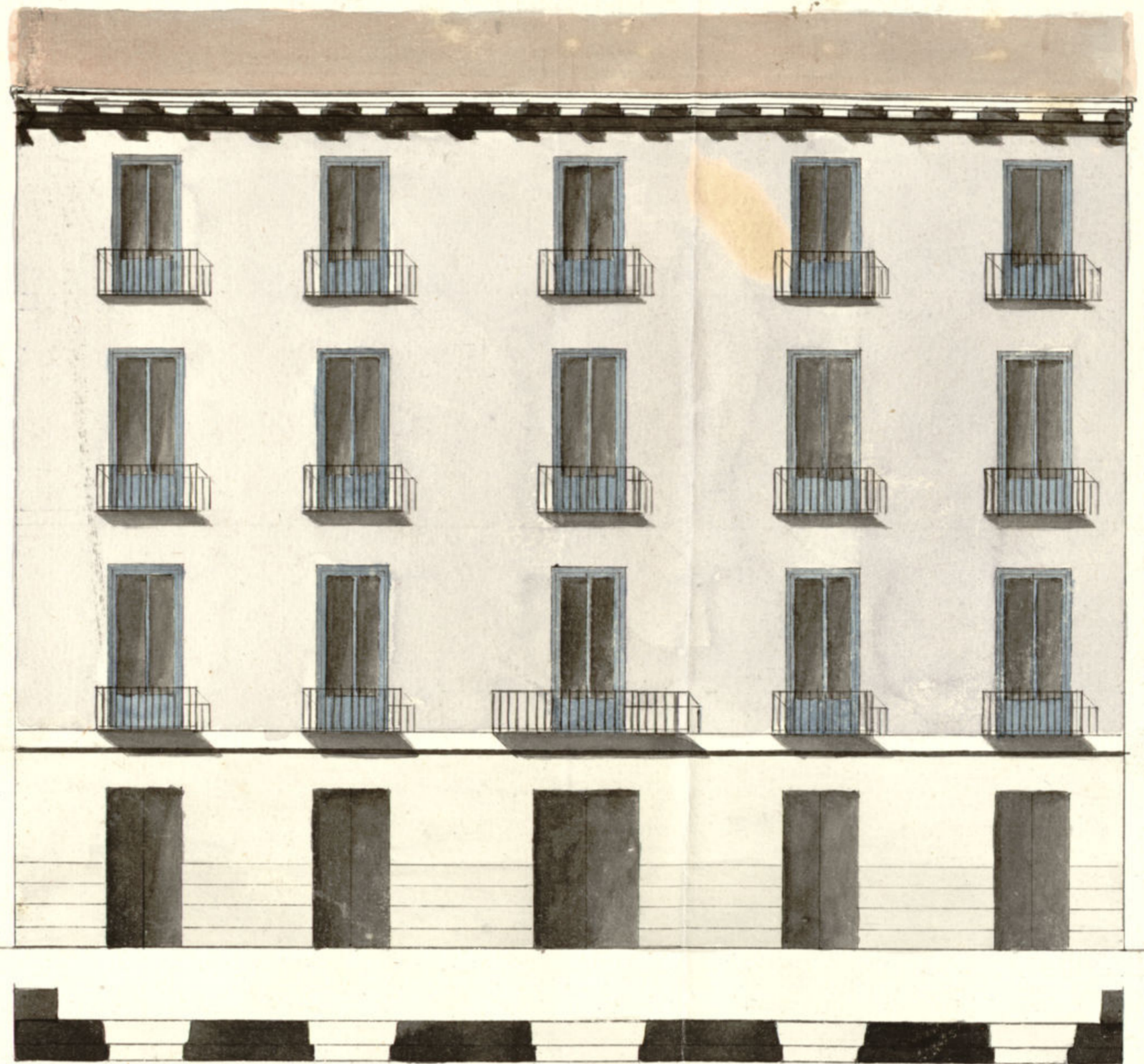
Fachada de la Calle de Jesus del Valle n.º m.º