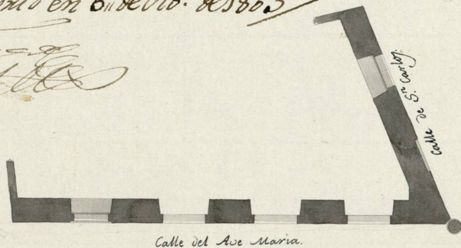
Calle del Ave Maria.