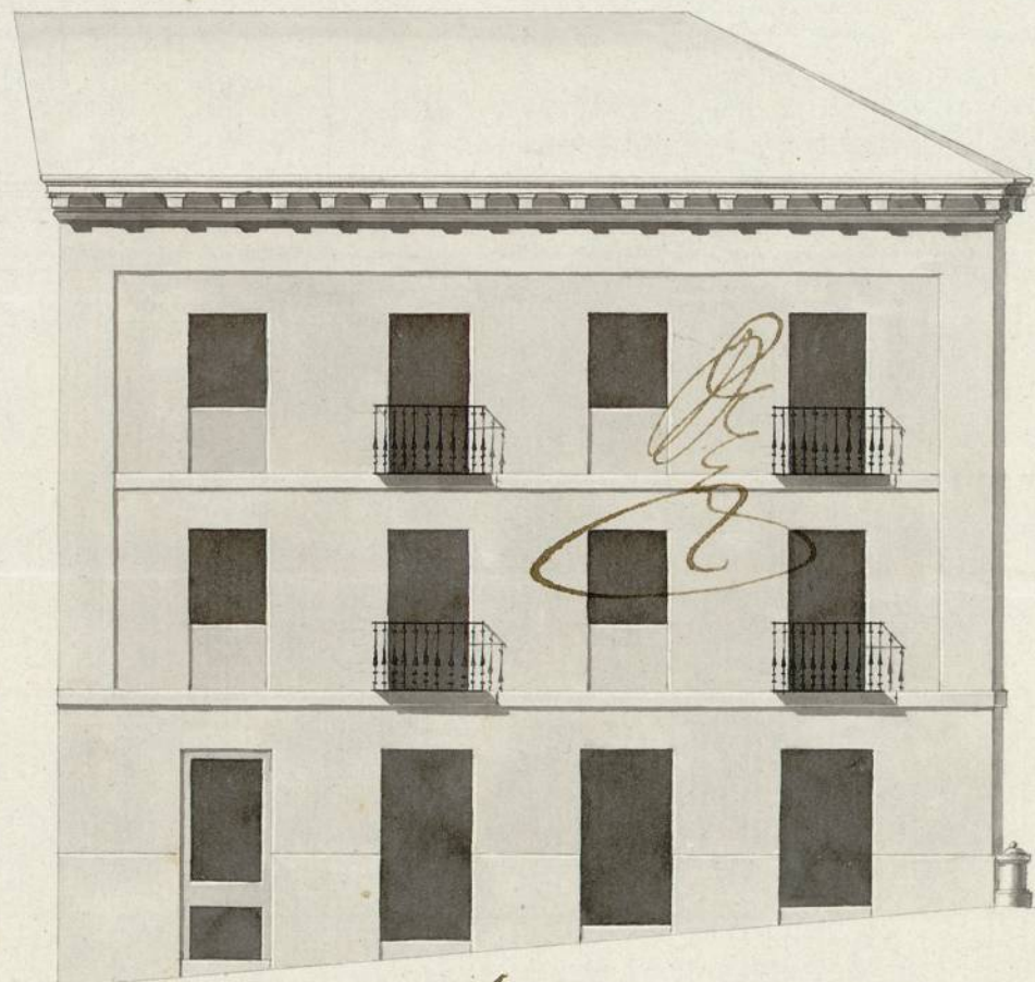
Fachada à la C. ta del Ave Maria