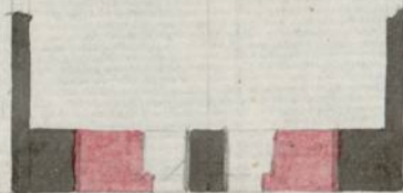
Escala de pies Castellanos