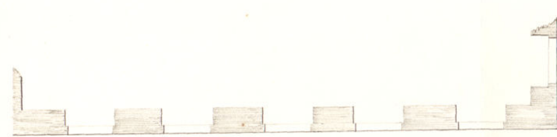
Calle de la Viuda n.º 2.