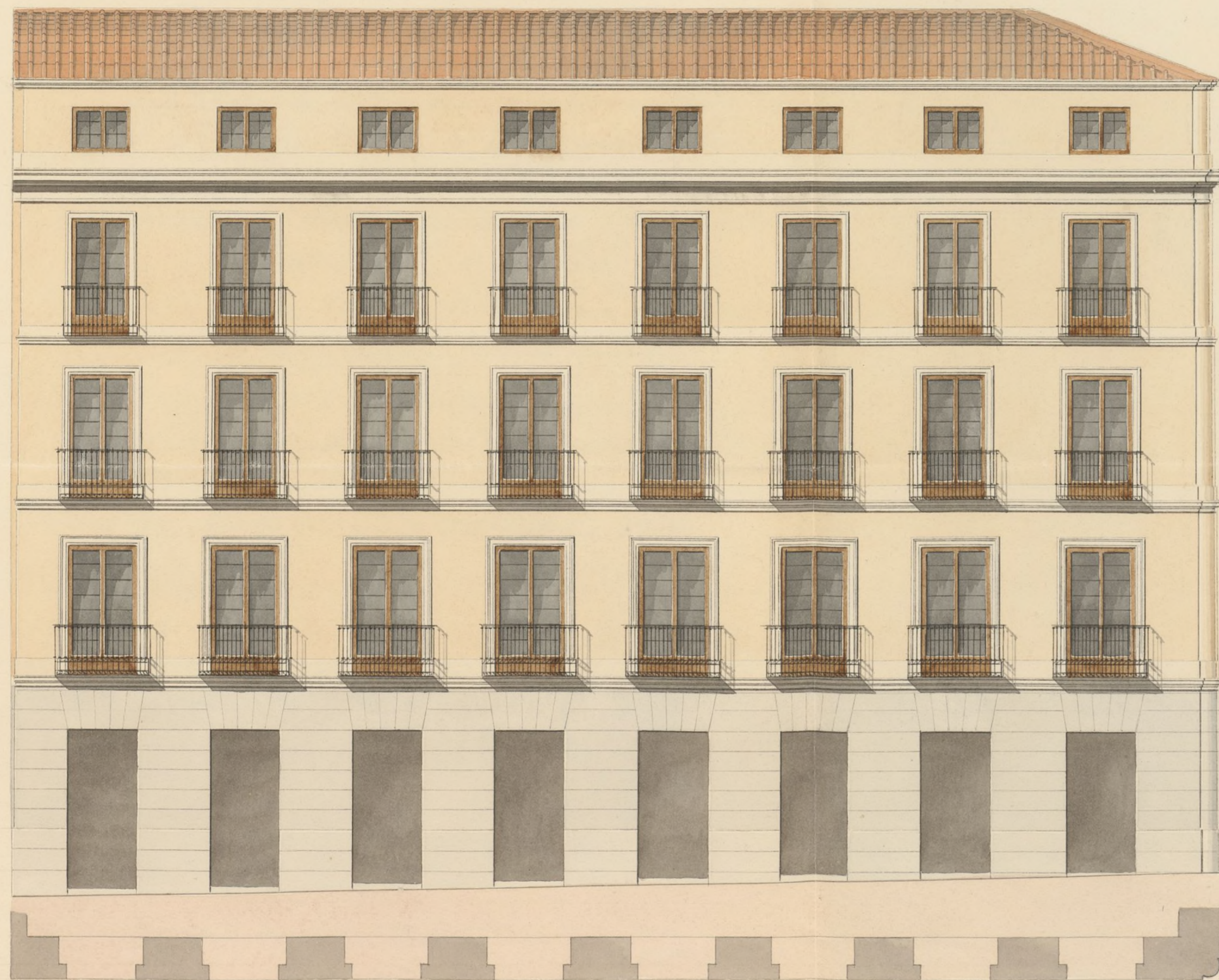
Calle del Arco de Santa Maria