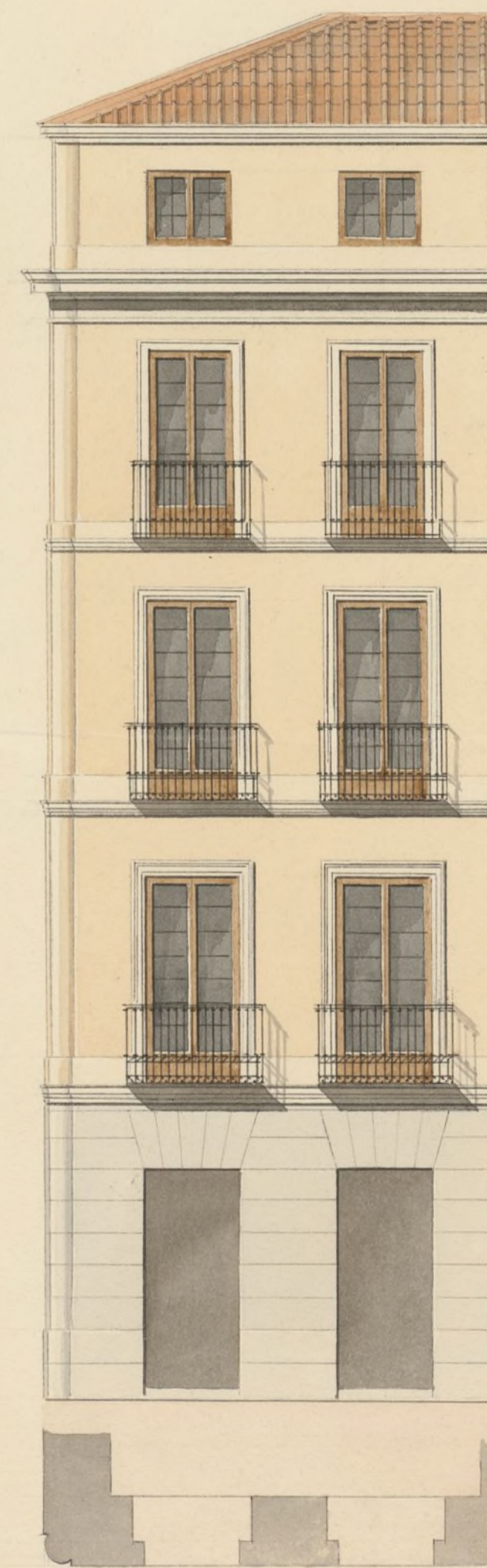
Calle de Hortalera.