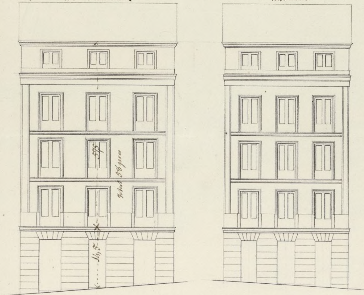
Fachada á la C. e del Portillo, n.º 6 moderno.

Esc. a 1/10 0 10 20 30 40 50 60 70 pies Cast.