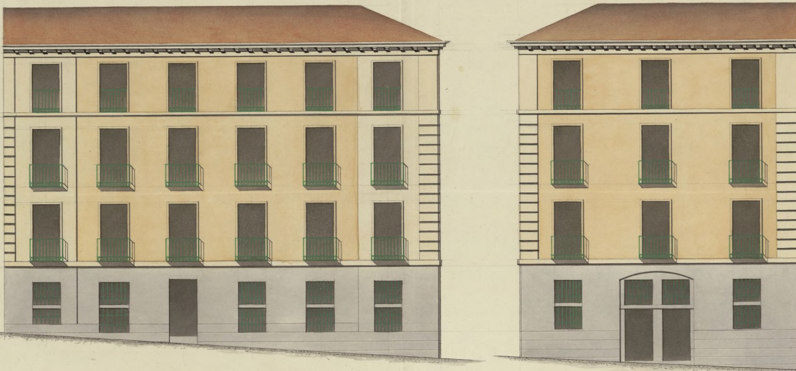
Fachada a la Calle del Molino de Viento.

Plano que manifiesta la reforma de las fachadas de la Casa sita en esta Corte y sus Calles del Molino de Viento N o 37. y D. o Felipe N o 7. de la M. a 460 : con la adiccion de piso segundo y tercero, sobre el principal que hoy existe ~