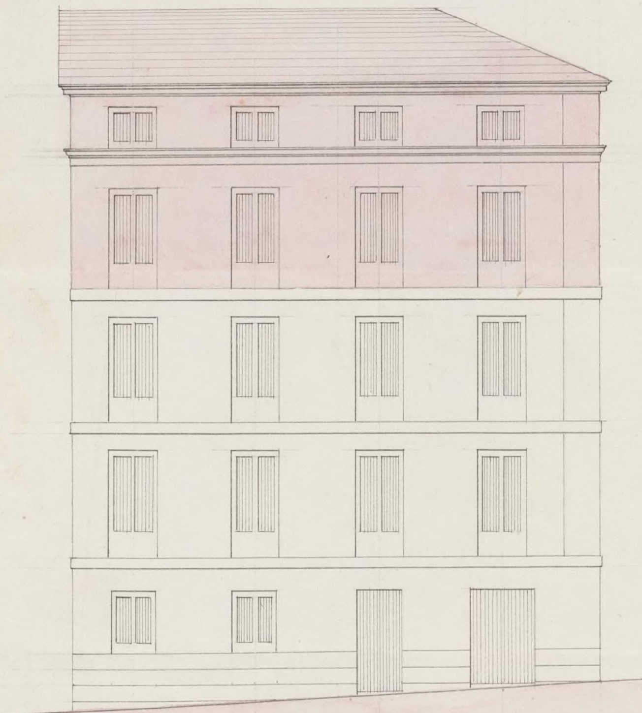
Fachada a la S. ta Bartolome