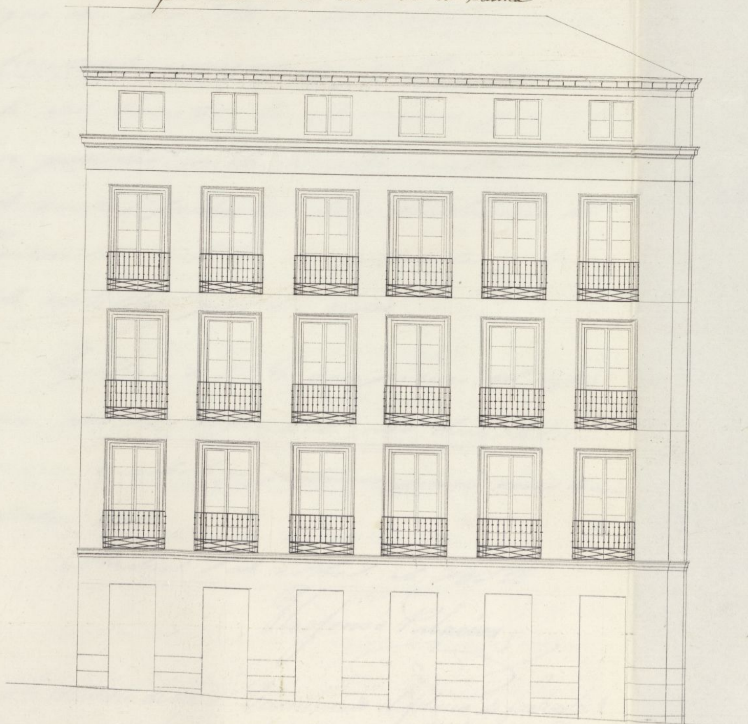
Fachada de la calle de la Palma