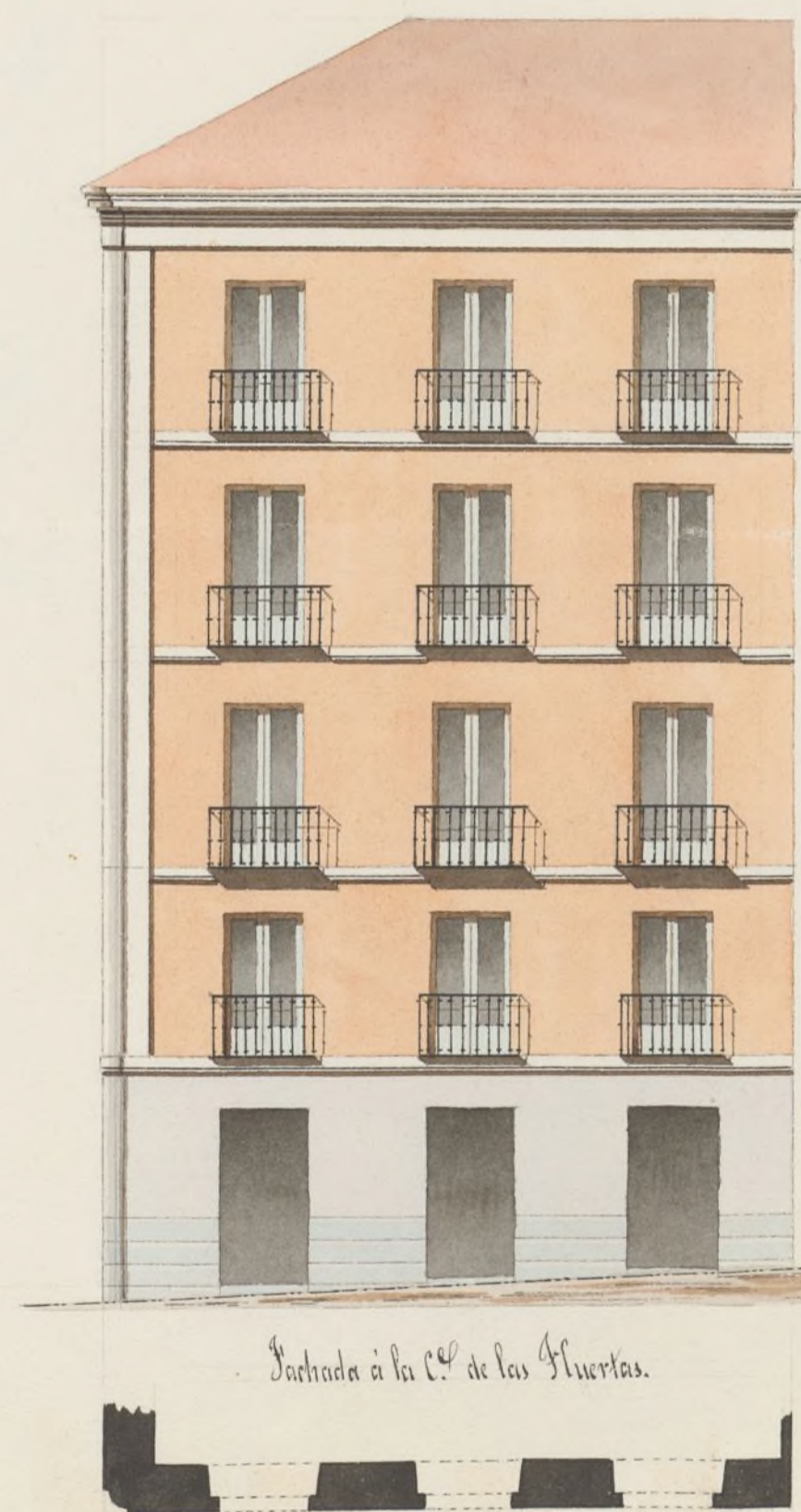
Fachada a la C. de las Puercas.