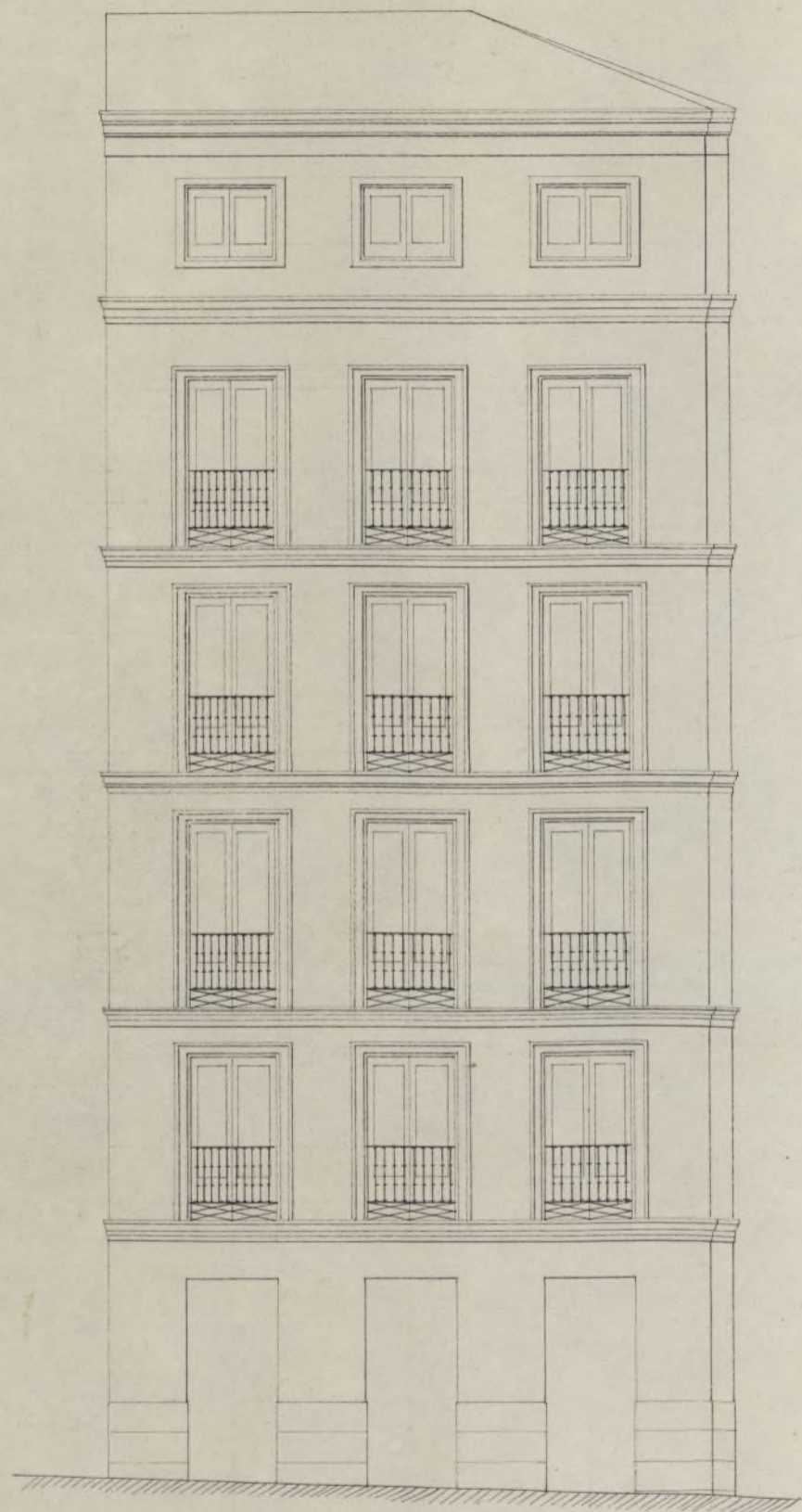
Fachada de la calle de San. Damaso