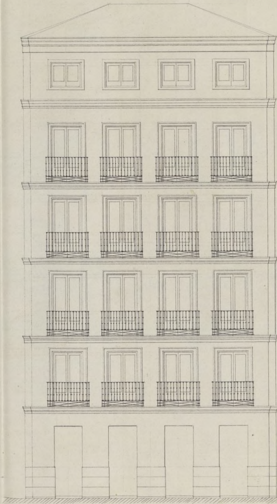
Fachada de la plazuela