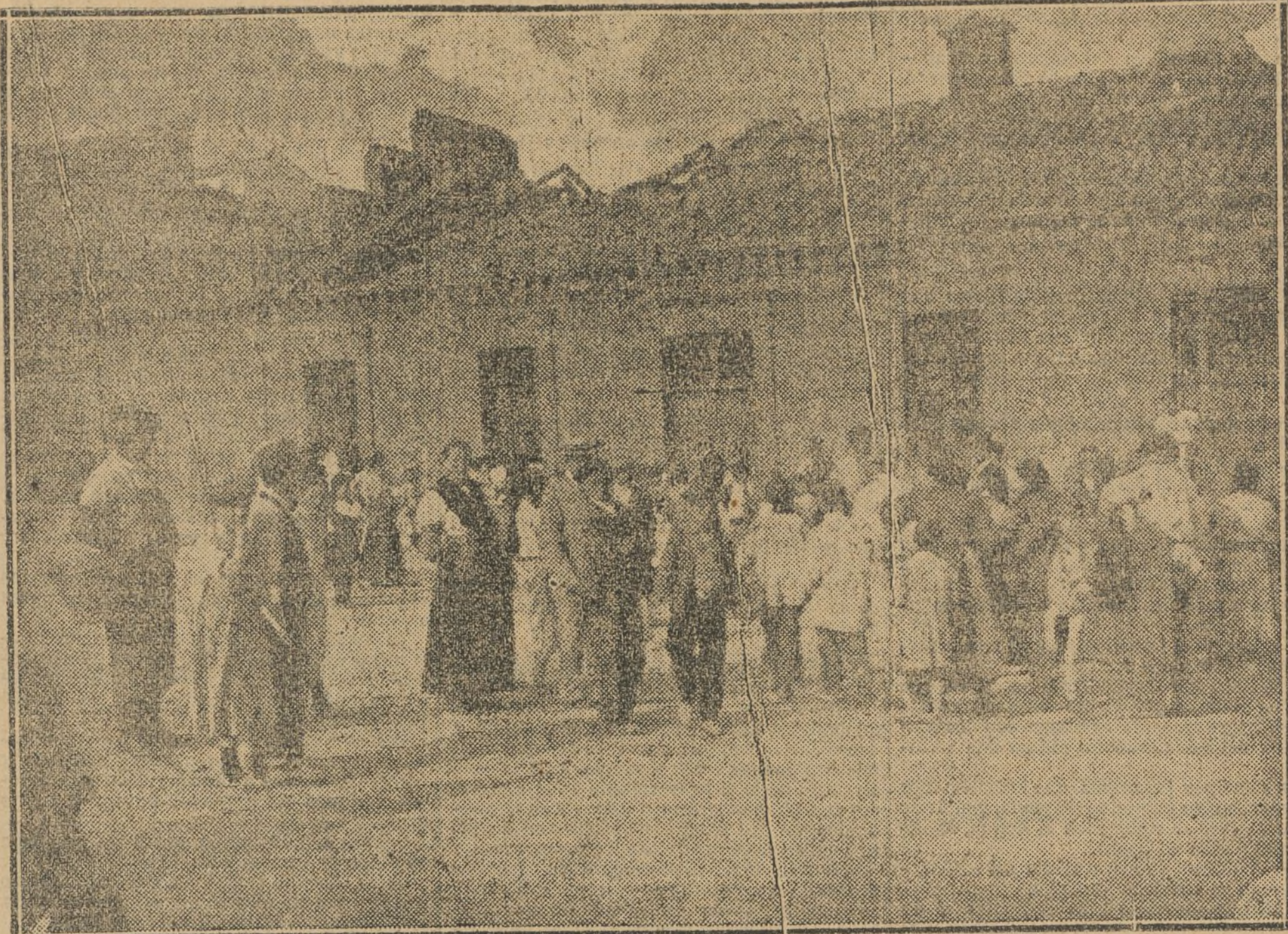
El público aglomerado en el lugar del siniestro.