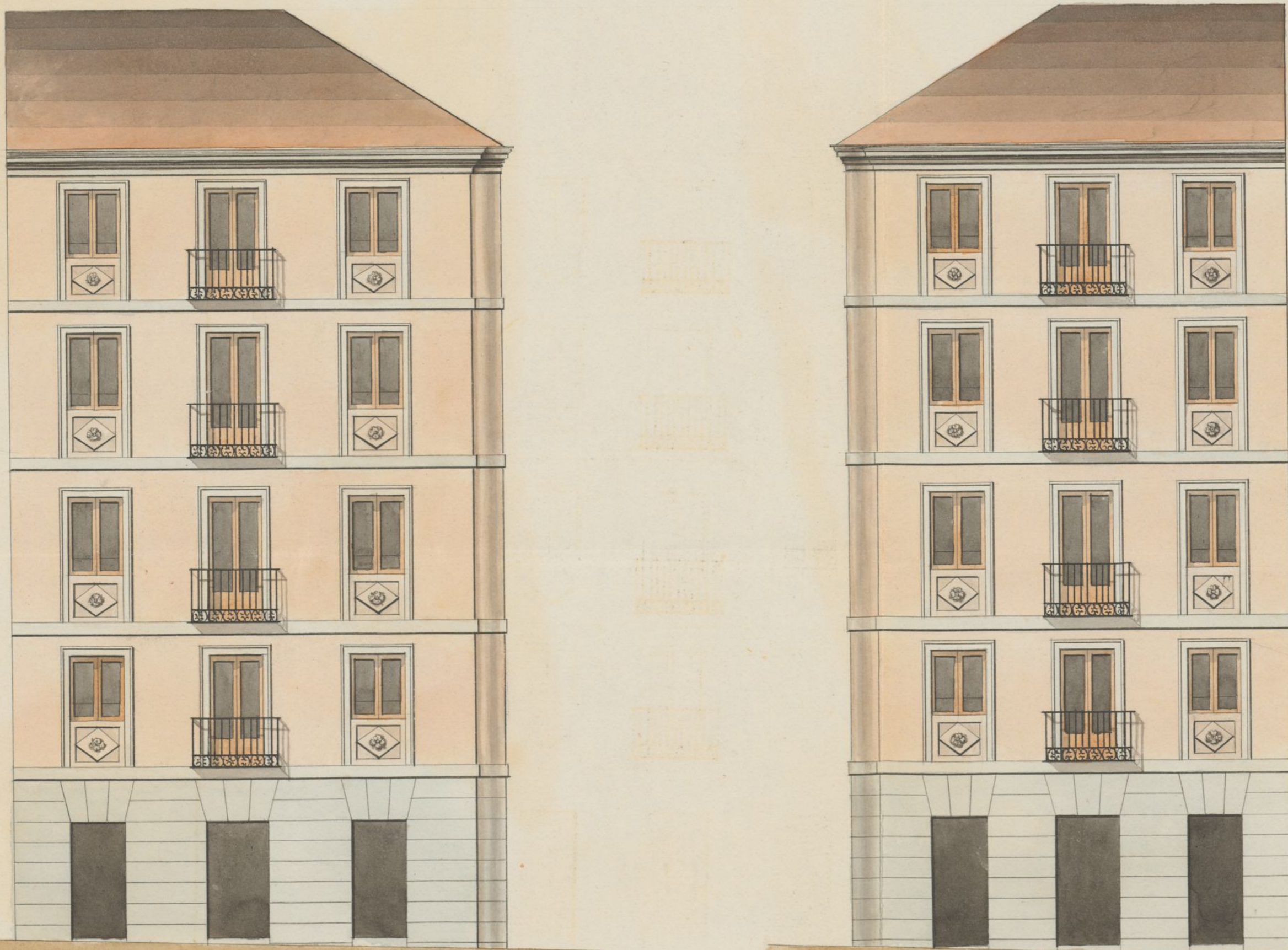
Calle de las Velas.

Plano de las dos fachadas para la casa que se vá a construir de nueva planta, si- ta en esta Corte y sus calles de Toledo y Velas, señalada con los numeros 2 y 85 nuevos, 12 antiguo, manzana 13 propia de Don Fernando Alonso.