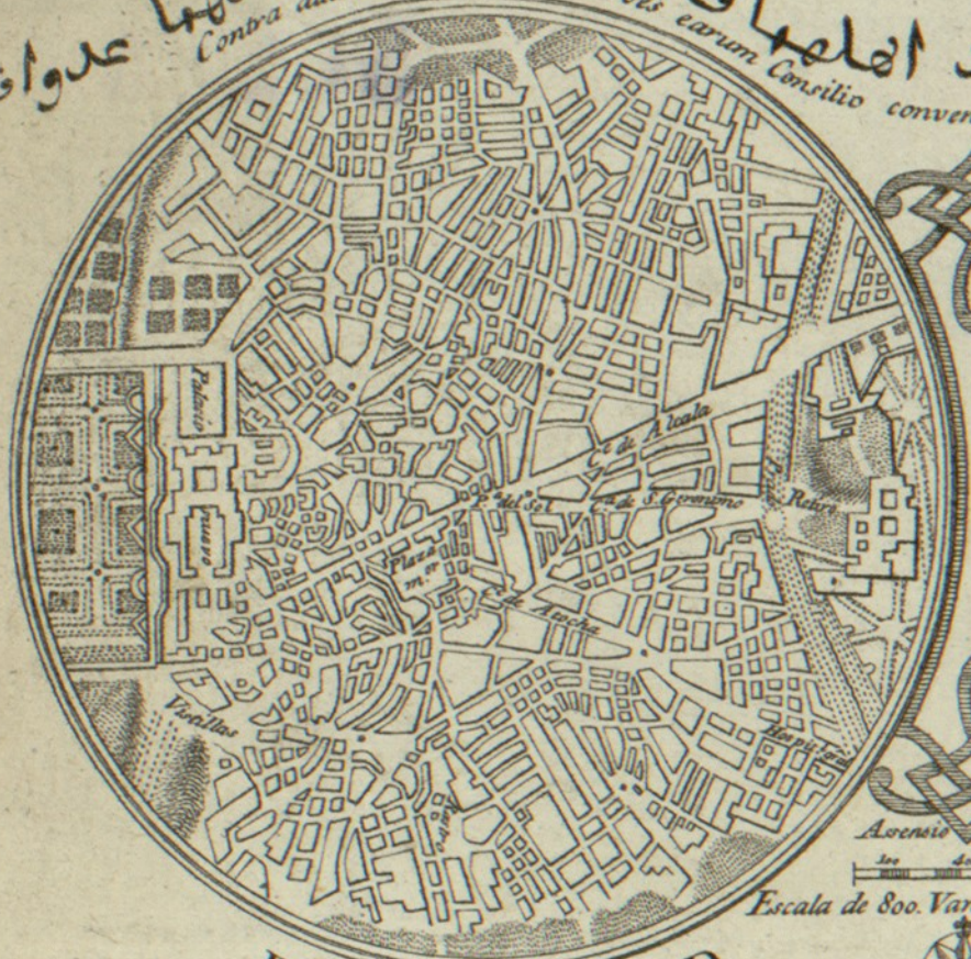
PLANO DE MADRID.