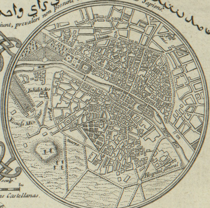
PLANO DE PARIS.