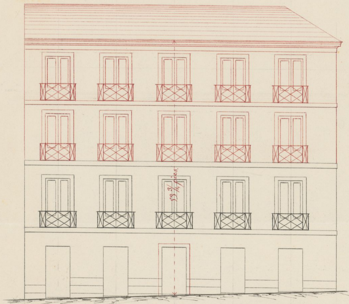
Fachada á la C. de S. Marcos n.º 24.