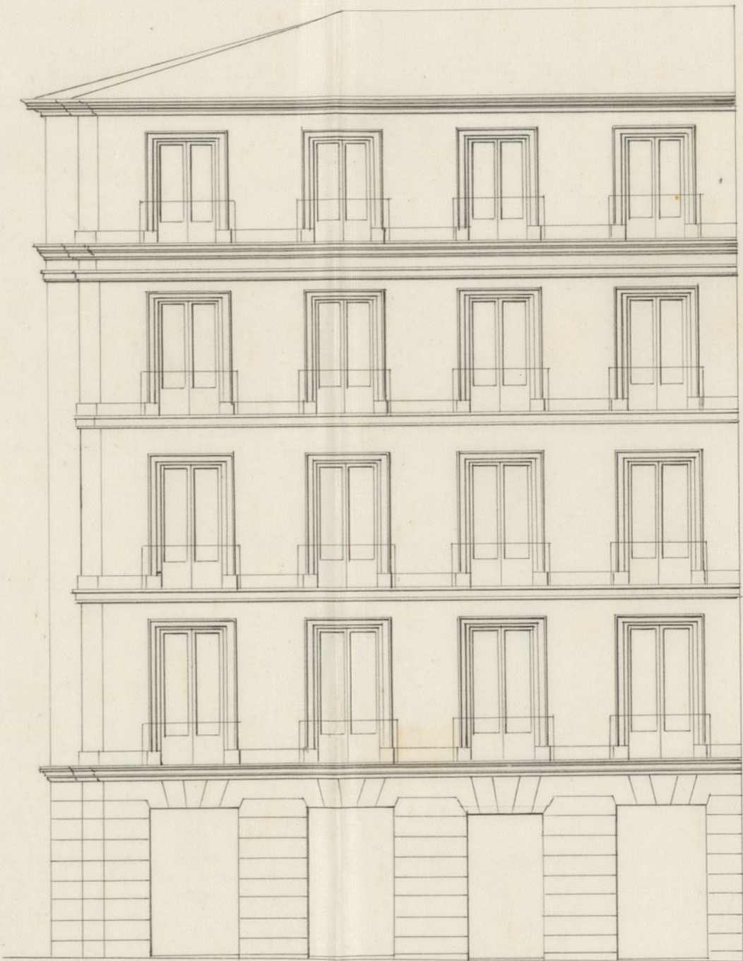
Fachada Calle de Fuencarral núm. o 56 nuevo.