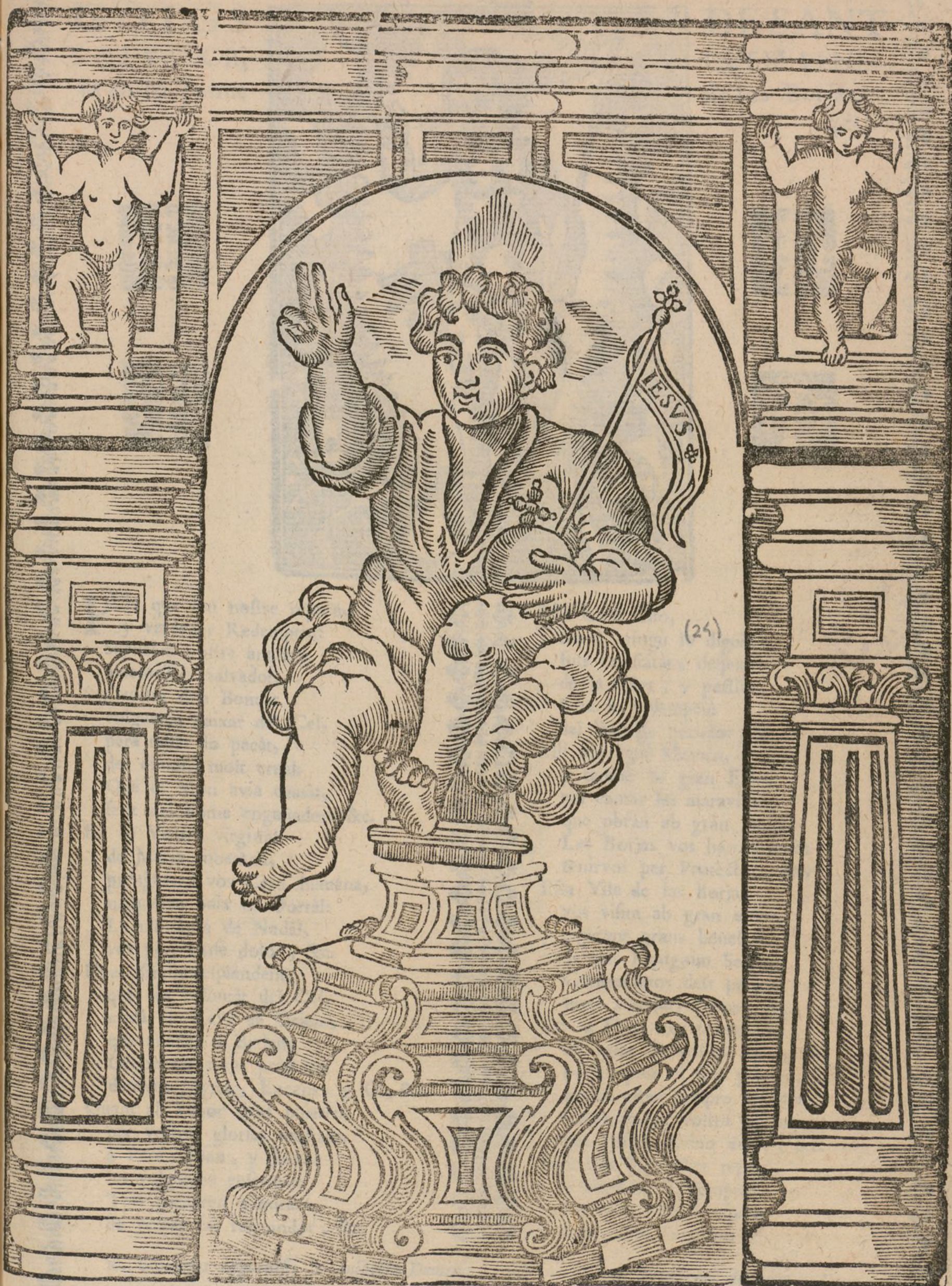
SANT SALVADOR , QUE SE VENERA EN lo Terme de las Borjas de Urgèll.