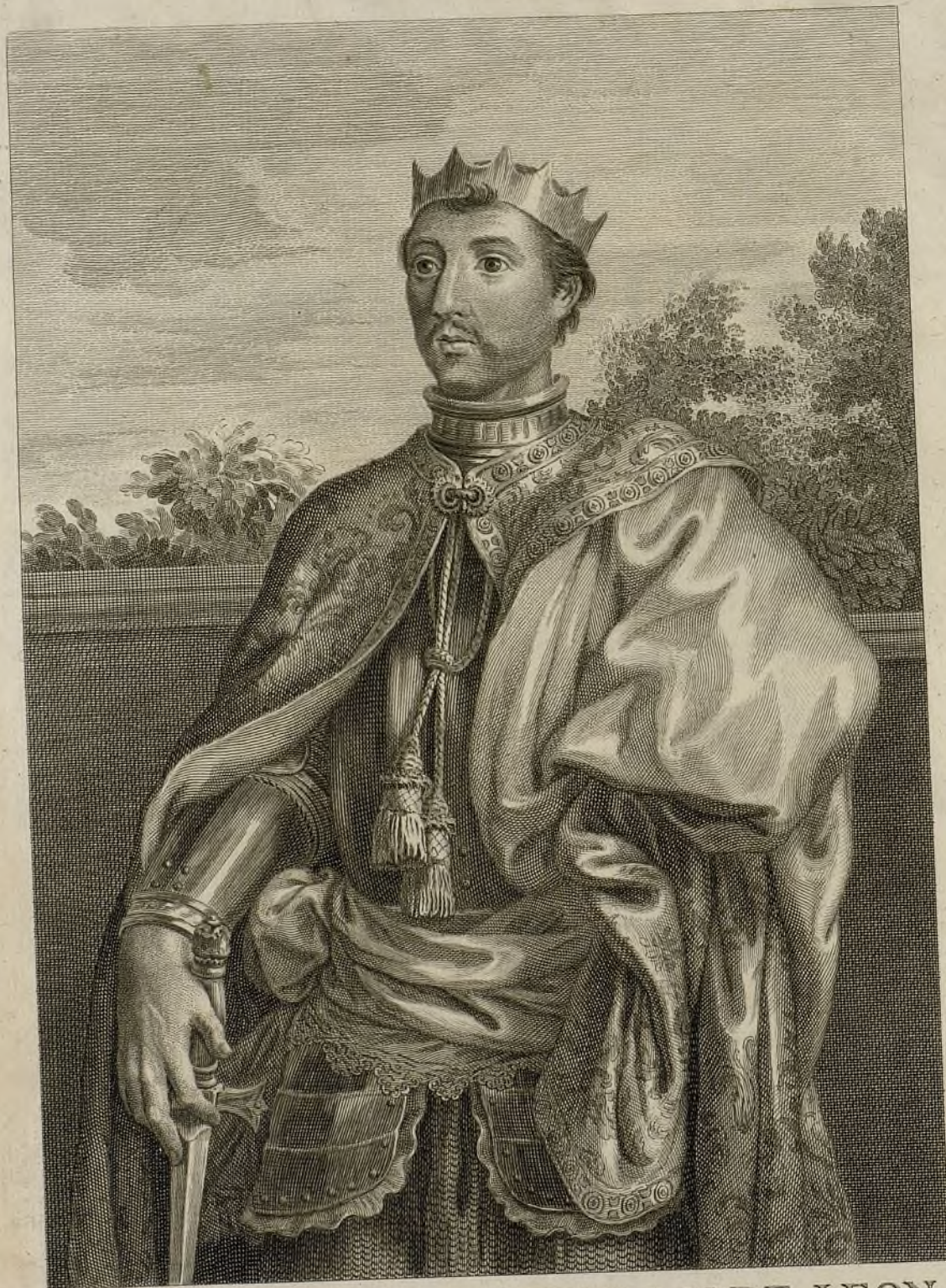
D. PEDRO REY DE CASTILLA, Y DE LEON.