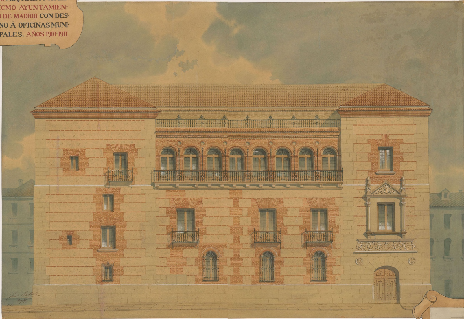
Fachada a la Calle del Sacramento. (Restaurada)

P ROYECTO DE RESTAU- RACION Y AMPLIACION DE LA CASA DE CISNE- ROS ADQUIRIDA POR EL EXCMO AYUNTAMIE- NTO DE MADRID CON DES- TINO A OFICINAS MUNI- CIPALES. AÑOS 1910 1911