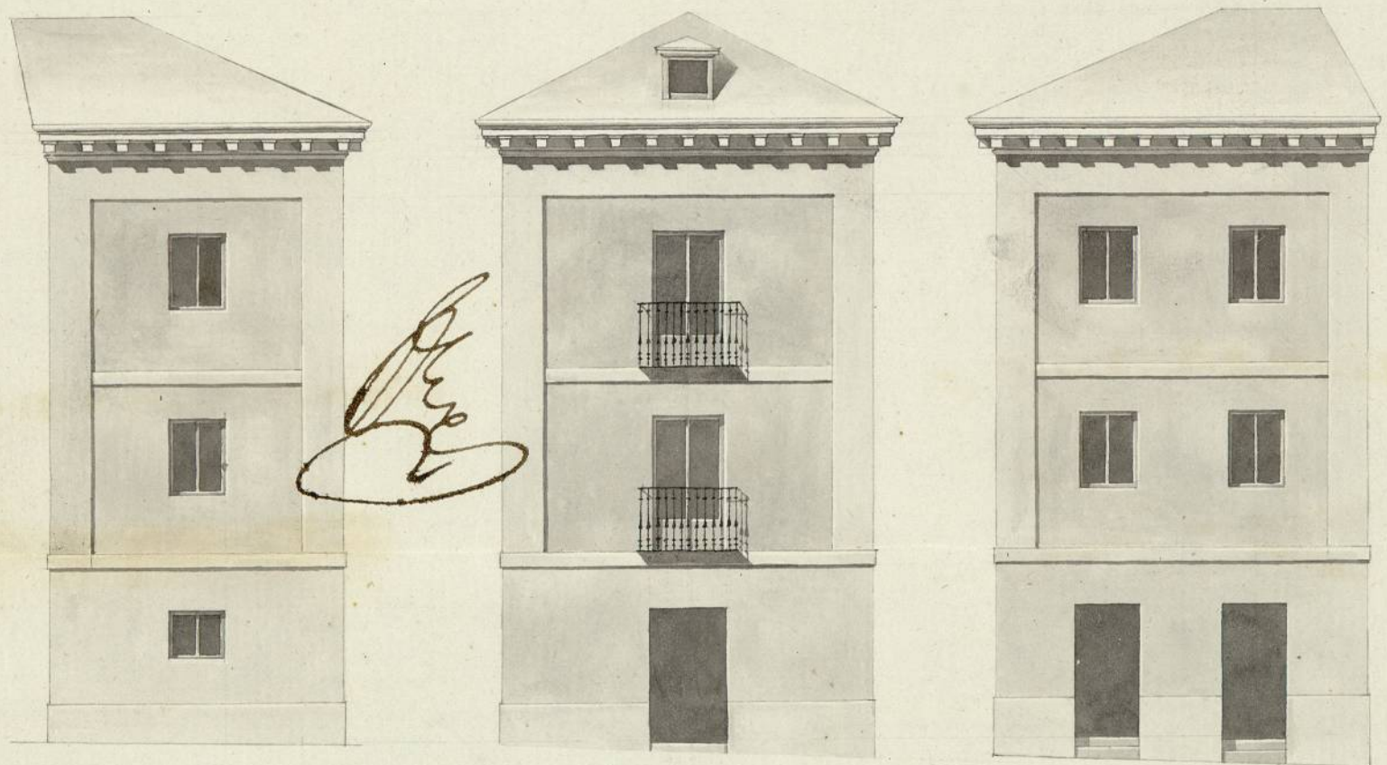
Fachada à Poniente

Informado à Madrid en 28.º de Sep.º de 1798