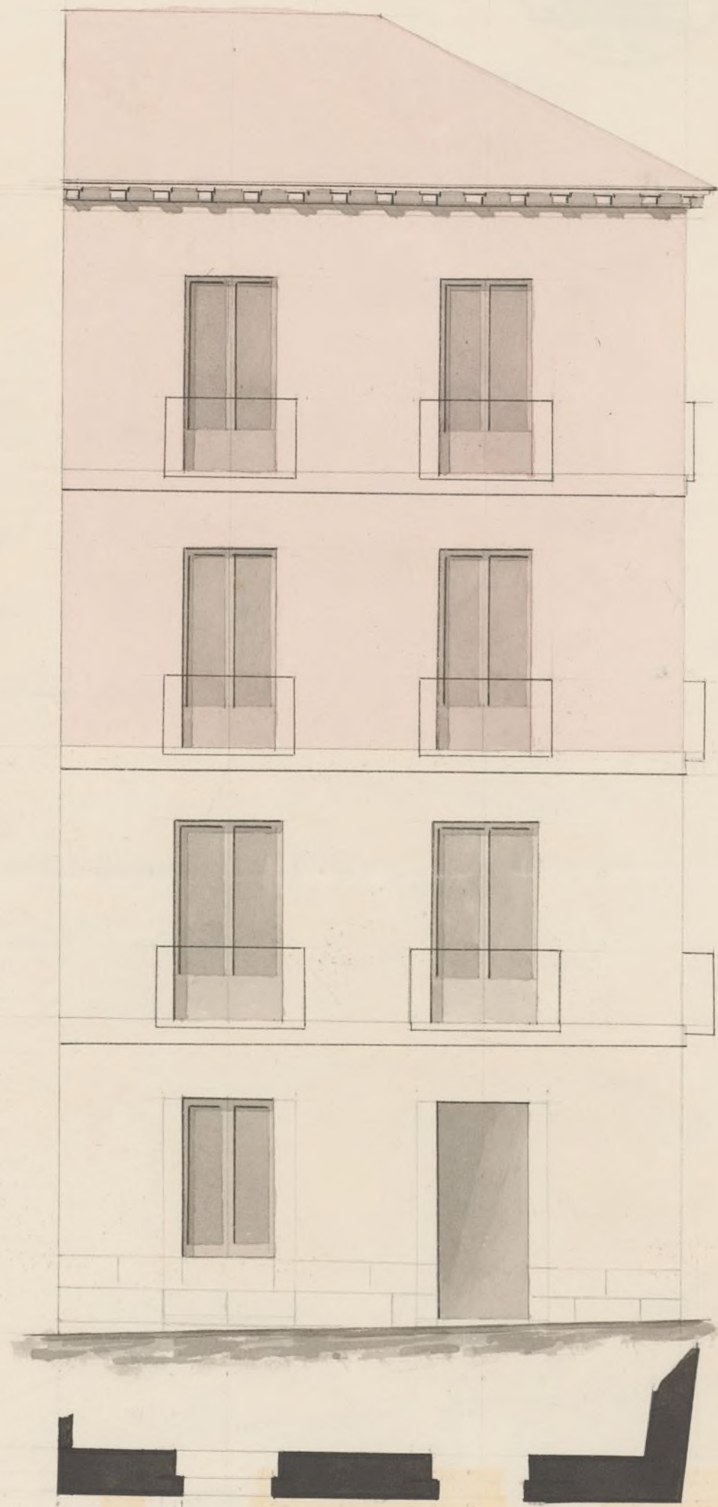
Calle de Colon num o 11