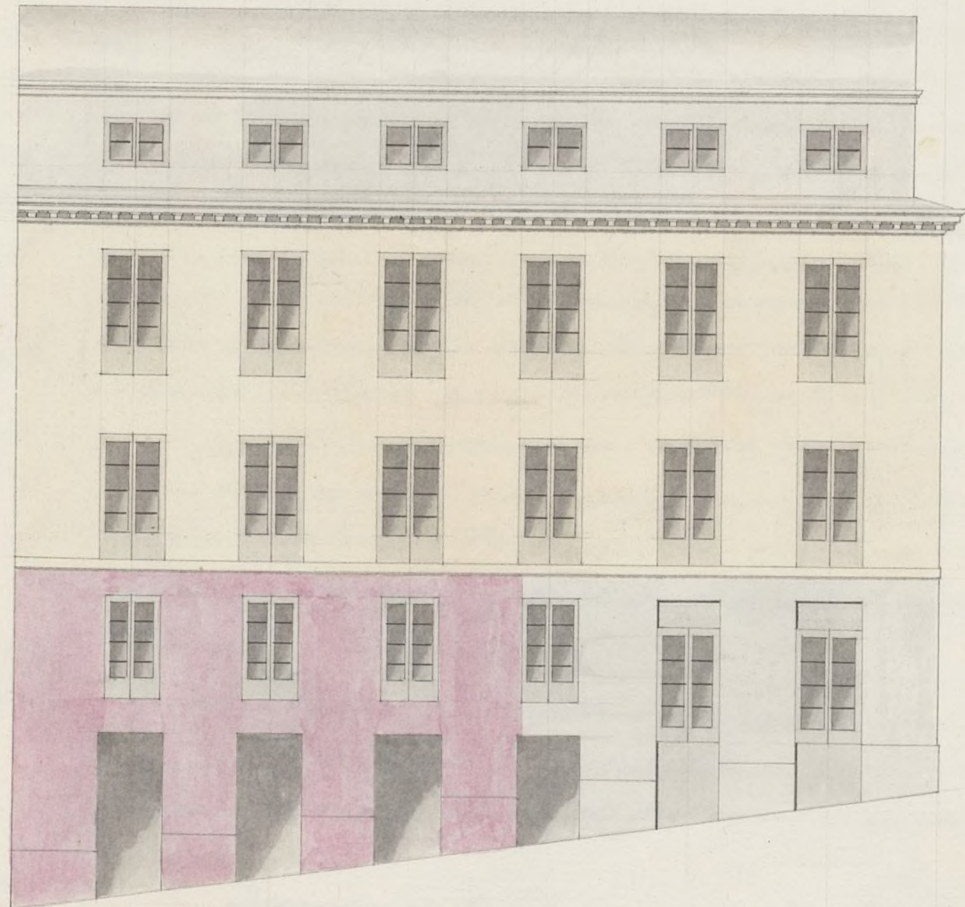
Fachada a la Costanilla de S. Vicente.