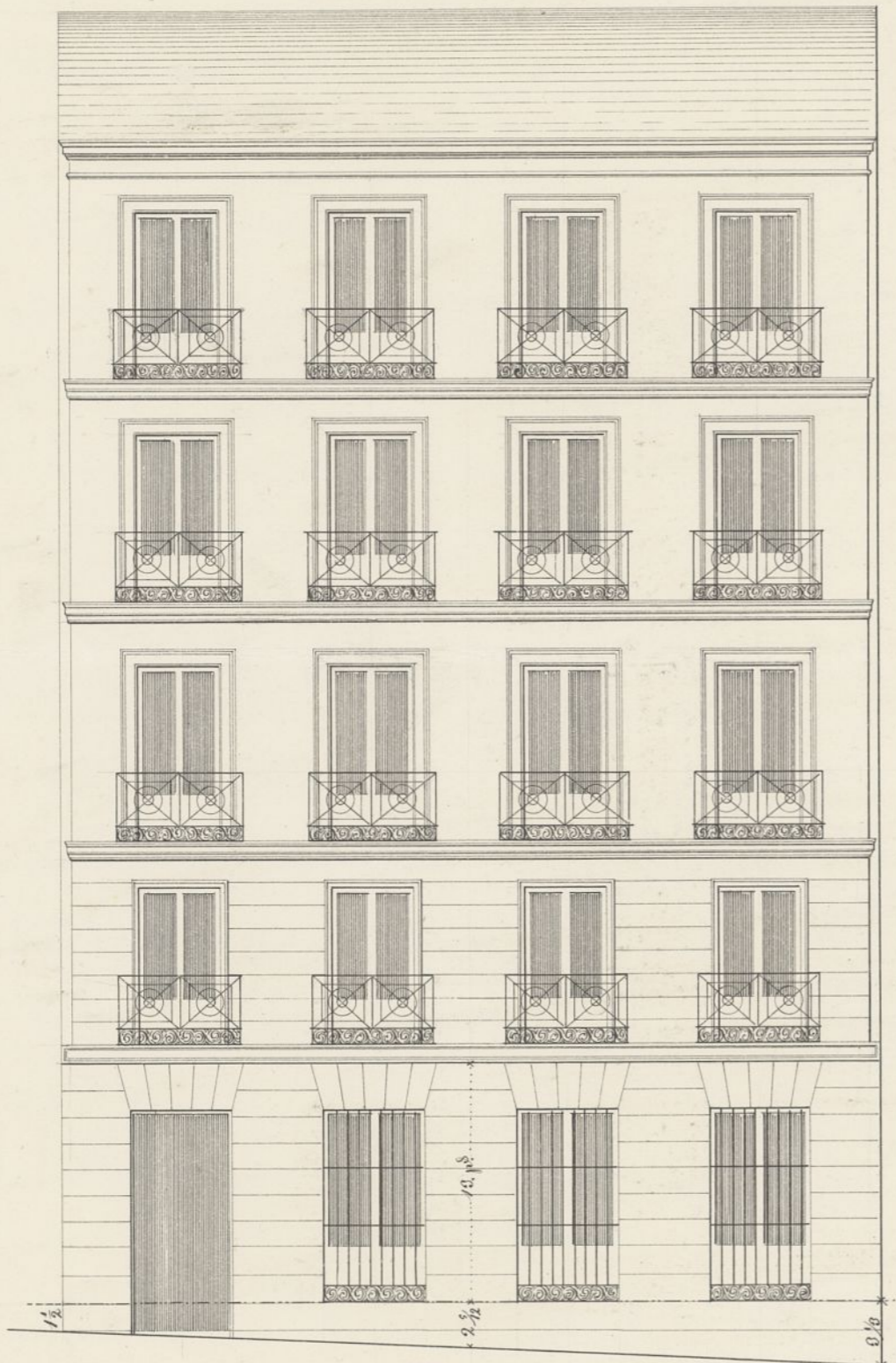
Calle de Pontejos