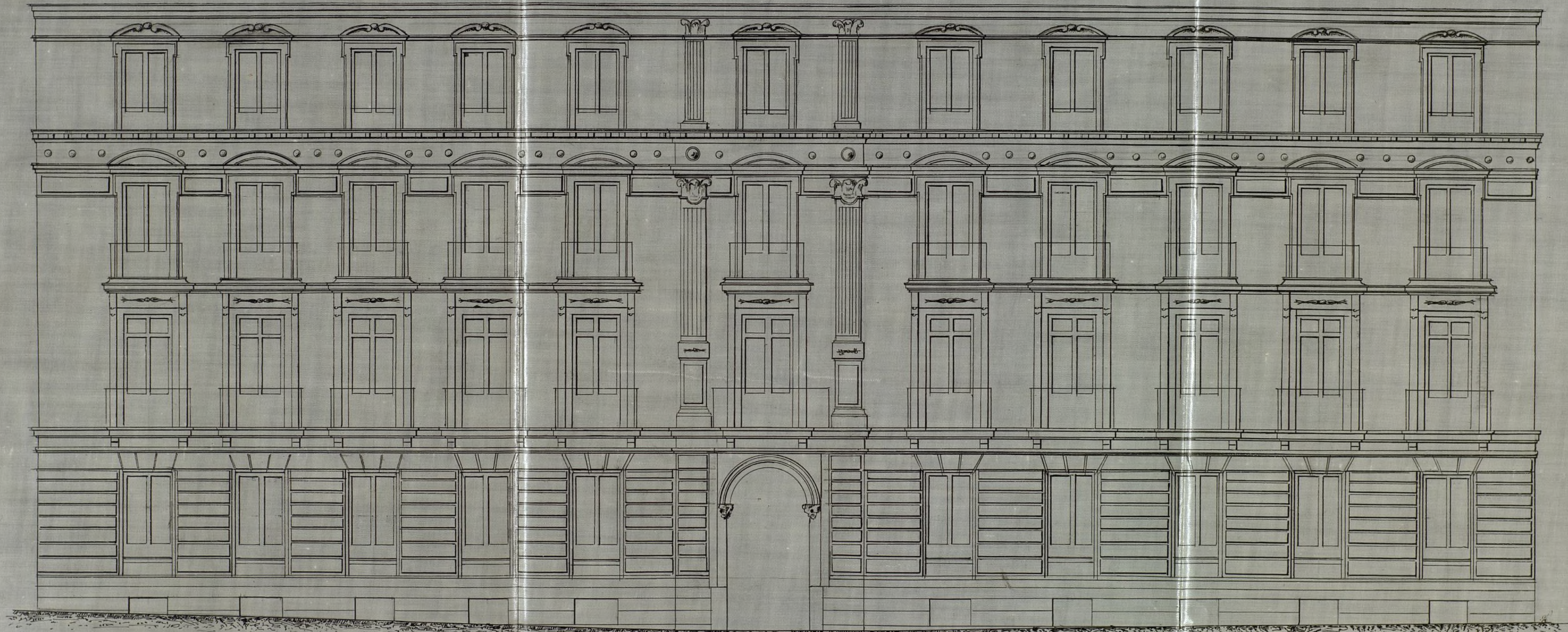
Fachada á la calle del Saeco.