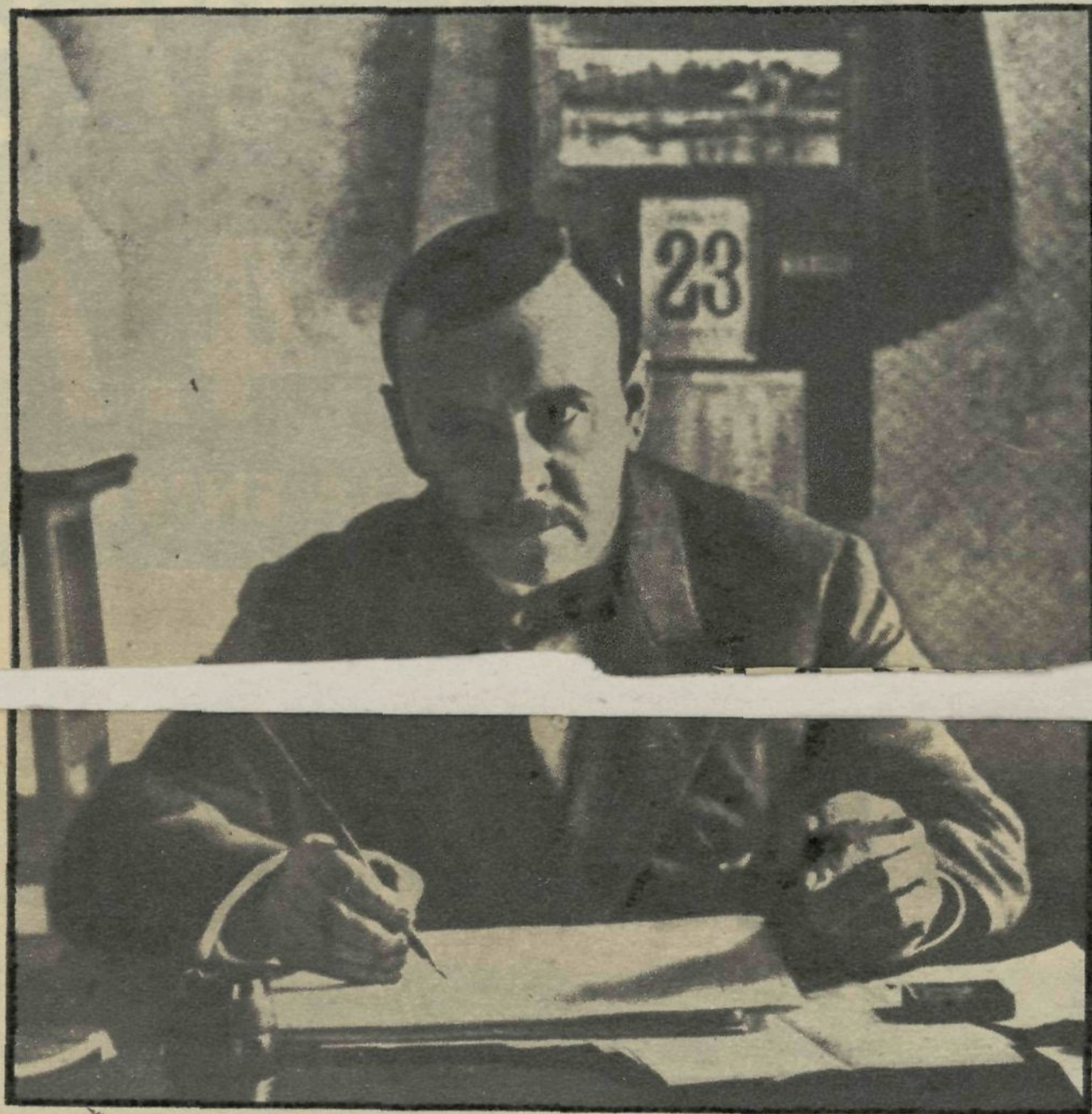
El maestro, en su despacho. Foto hecha unos meses antes de haber estrenado en el desaparecido teatro Apolo la zarzuela en dos actos "El minué real"