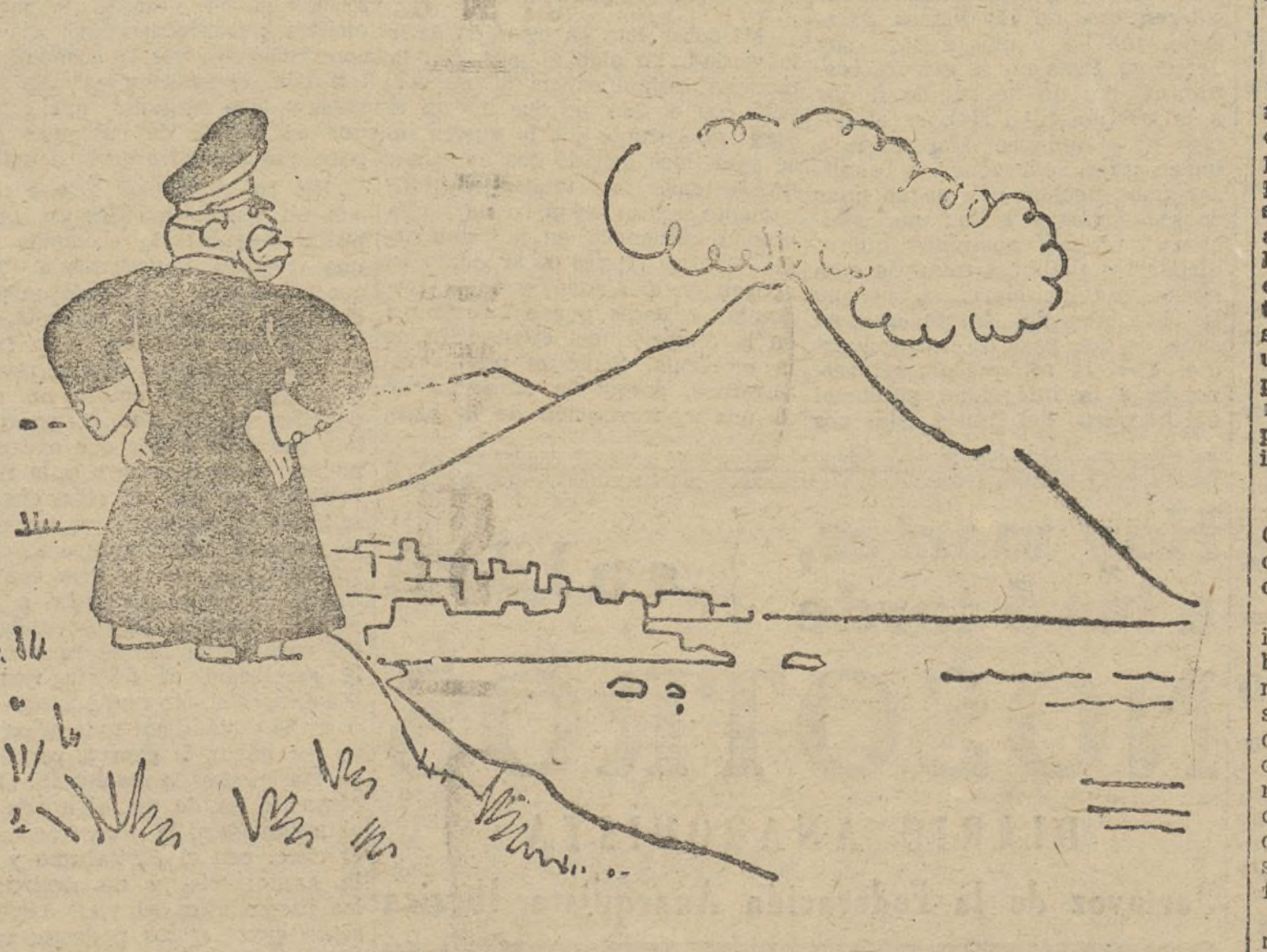
...Una cima de granito que escapa a fuego!

«Nuestro ideal político es una roca, una cima de granito.» (Mussolini.)