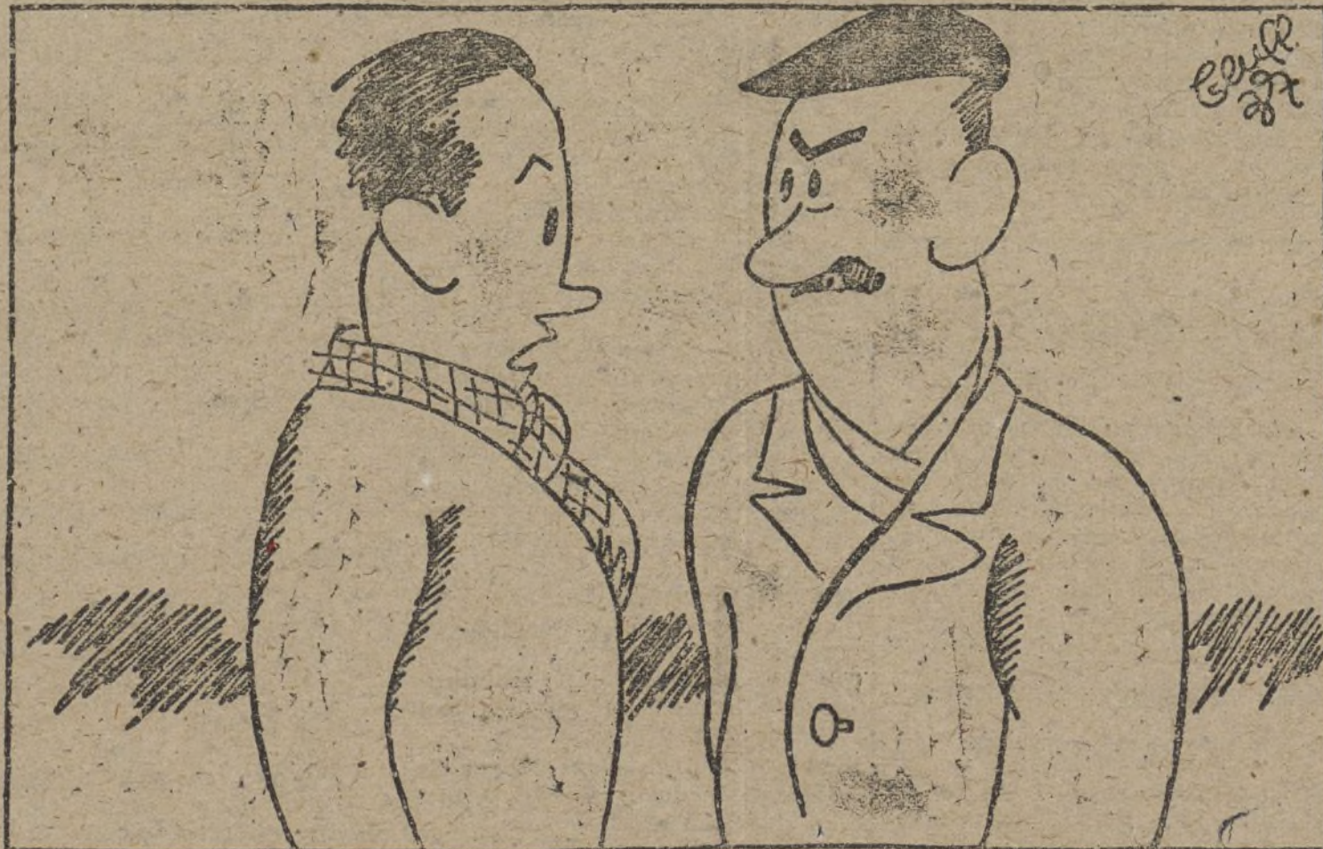
—Como la Victoria de Samotracia la representan sin cabeza, hay quien se ha creído que la victoria de aquí puede ser igual.

que sirvieran para alejar a nuestros barcos de los lugares donde actuaban los auténticos buques facciosos.